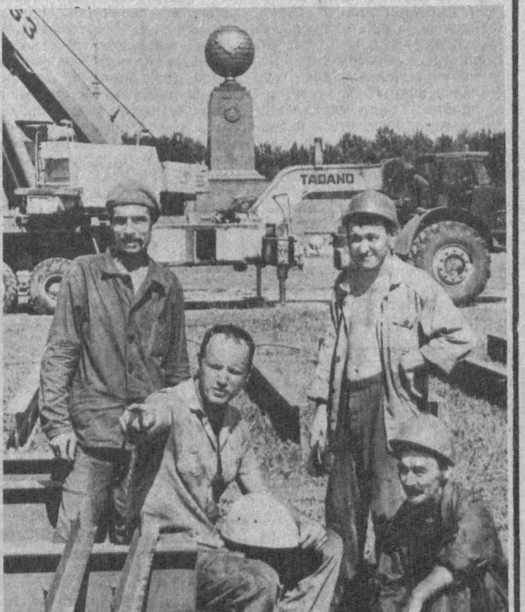
На столичной площади Мустакиллик, где состоится торжества в ознаменование второй годовщины независимости республики, идет монтаж стальных конструкций сцены и подиума. Производятся работы — Тамшум треста «Узгаль-конструкция».

Прошло первое заседание оргкомитета. Заслушана информация председателя Федерации бокса Узбекистана, руководителя государственной ассоциации по производству товаров легкой промышленности «Узбеклег-