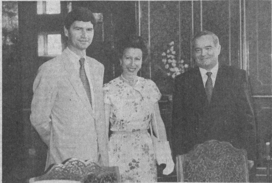
Во время приема.