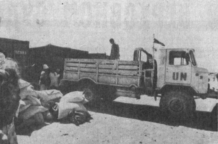
Таджикистан — горячая точка

Во встрече принимали участие ученые академии наук России и Узбекистана. (УзА).