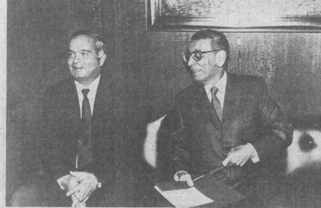
НА СНИМКЕ: Президент Республики Узбекистан Ислам Каримов с генеральным секретарем ООН Бутросом Гали.

Некоторые республики, обобщились своей географической принадлежностью к Европе и позабыв о неизбежных трудностях переходного периода, взяли курс на «шоковую терапию». В результате большая часть их населения оказалась в тяжелейшем положении.