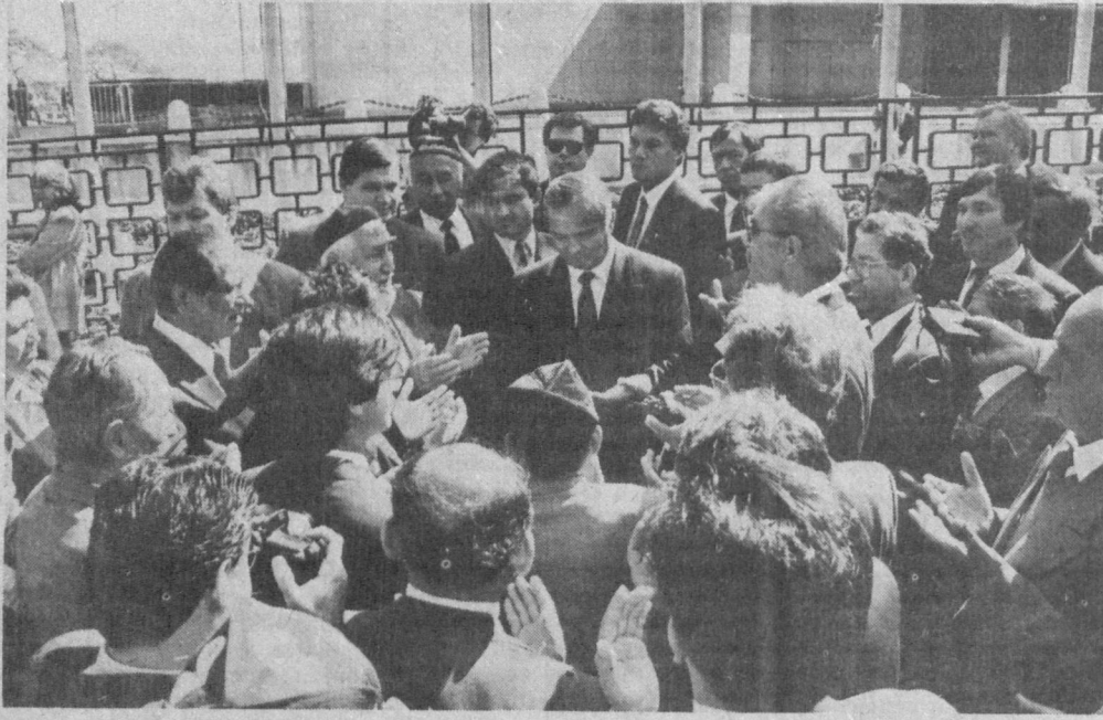
НА СНИМКЕ: во время встречи с соотечественниками.

В результате фабрики и заводы работают, вузы и школы открыты, пожилые люди и многодетные родители получают пенсию и пособия, не забыты и инвалиды, никто не роется в помятах. Как бы эти слова и нравилась нашим недругам, промгласно обвиняющим нынешнюю политику в тоталитаризме, мы должны сказать: своим умом мы понимаем, что переживаемые сейчас трудности — это цветочки по сравнению с теми «подарками судьбы», которые могут нам преподнести те самые нелюбимые нас «собратья». Мы хотим сказать, что маховик государственной машины настолько массивен, тяжел, что не каждому под силу привести его в движение. Сладкими обещаниями народ не проморить. У голословных заявлений жизнь тоже коротка.