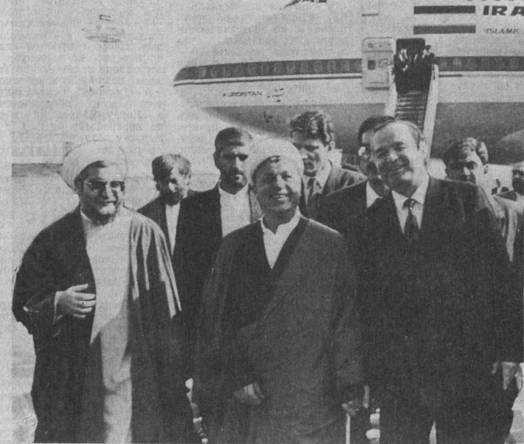
НА СНИМКЕ: встреча в аэропорту.