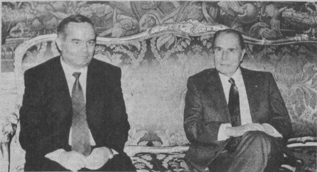
НА СНИМКЕ: беседа президентов.

Подписанием солидного пакета важнейших двусторонних документов, взаимной убежденностью сторон в необходимости расширить сотрудничество, завершился государственный визит Президента Республики Узбекистан Ислама Каримова во Францию.