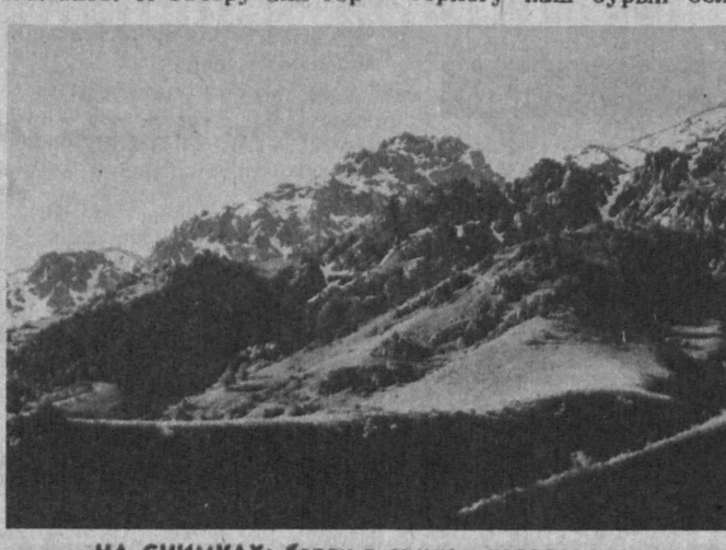
НА СНИМКАХ: баран в зимнем наряде; в горах уже зима.