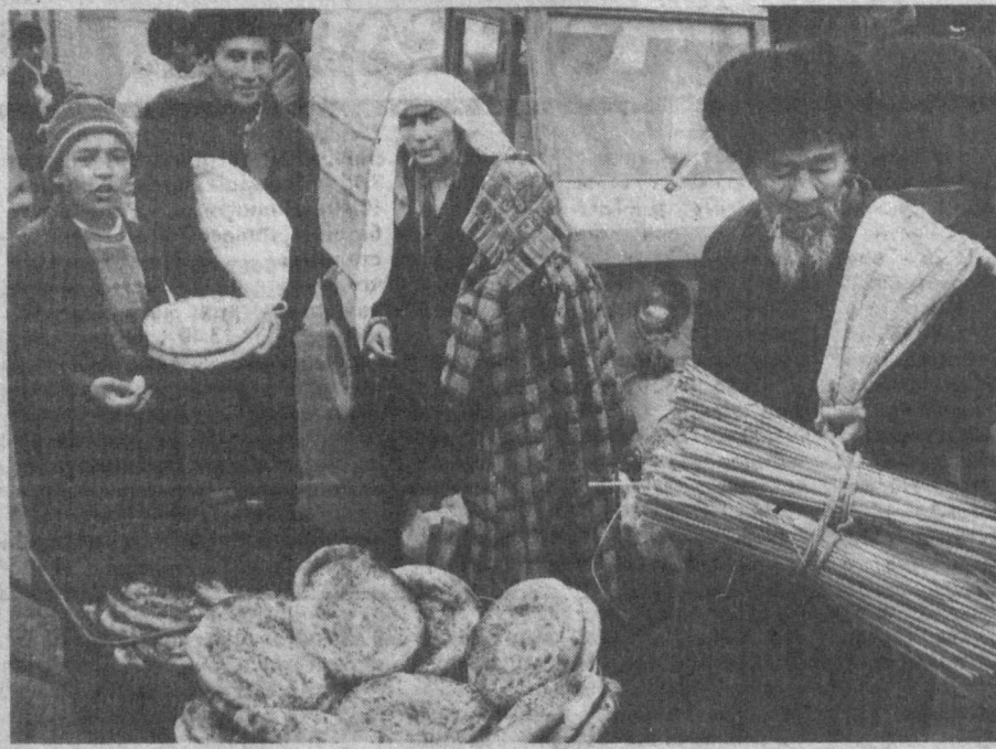
Из серии «Махалля».