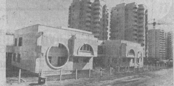
Хороший подарок получили ребяташки Шайхантаурского района столицы. Для них открыт чудесный детский сад. Построили его работники 149-го управления строительства № 12. НА СНИМКАХ: детский сад № 226; веселый праздник во время открытия детского сада.