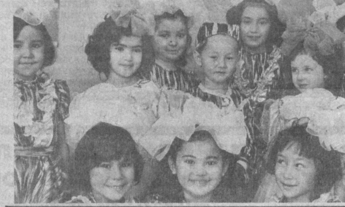
Человек. Общество. Закон.