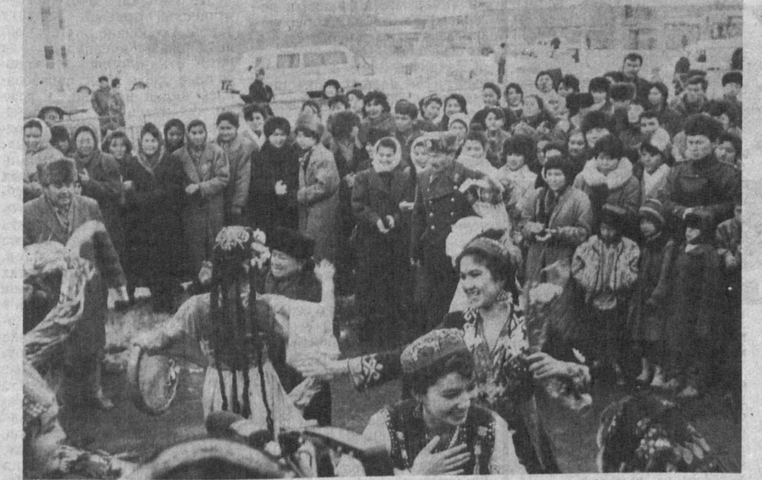
Дни культуры ташкентцев в Каракалпакстане. Тепло встречали жители махаллей города Нукуса участников декады — известных поэтов, писателей, деятелей искусства.

В России скопились уже десятки подобных субмарин. И пора руководству страны решить их судьбу и подумать о том, чтобы уникальные экземпляры подлодок использовать, может быть, в качестве музейных экспонатов.