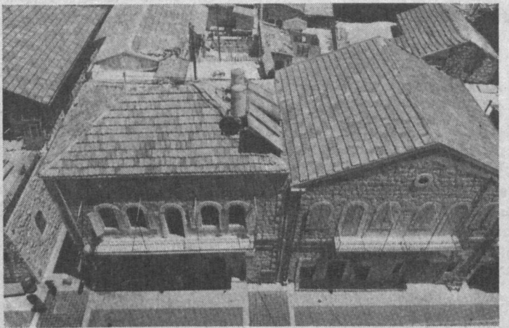
НА СНИМКЕ: Нахлат-Шива с птичьего полета.

с фигурными перилами, стилизованные светильники и торговые вывески. Сейчас Нахлат-Шива привлекает туристов и жителей города своими уютными двориками и удобными проходами, фасады пестрят вывесками маленьких магазинов, галерей, ресторанчиков.