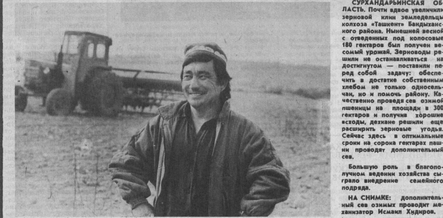
Сурхандарьинская область. Почти вдвое увеличился зерновой или земледельцев колхоза «Ташкент» Бандишанского района. Нынешней весной с отведенных под колосовые 180 гектаров был получен весомый урожай. Зерноводы республики не останавливаются на достигнутом — поставили перед собой задачу: обеспечить в достатке собственным хлебом не только односторонний район. Качественно проведя сев озимой пшеницы на площади в 300 гектаров и получив хорошие всходы, деятели решили еще расширить зерновые угодья. Сейчас здесь в оптимальные сроки на сорока гектарах пшеницы проводят дополнительный сев.