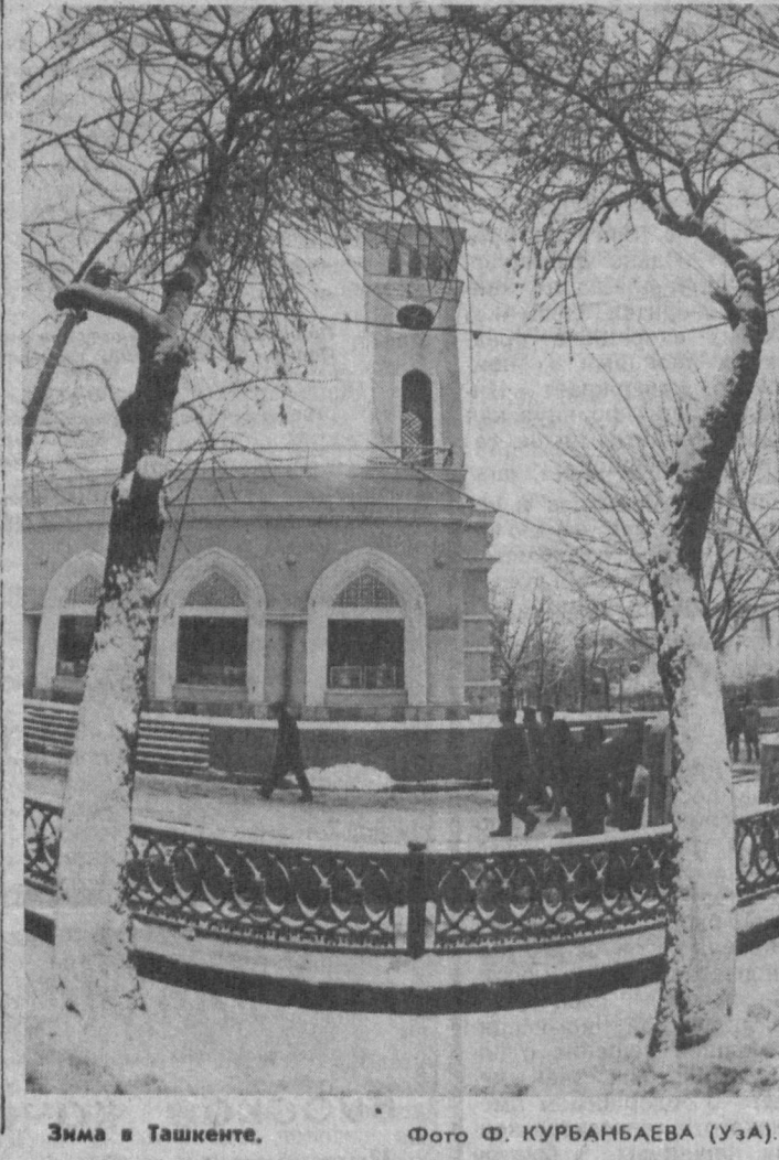
Зима в Ташкенте.