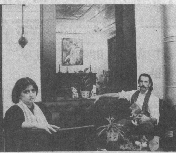
«ЧЕРЕПАХА И СКРИПКА» — ТАК НАЗЫВАЕТСЯ ПЕРВАЯ В РЕСПУБЛИКЕ ЧАСТНАЯ ХУДОЖЕСТВЕННАЯ ГАЛЕРЕЯ