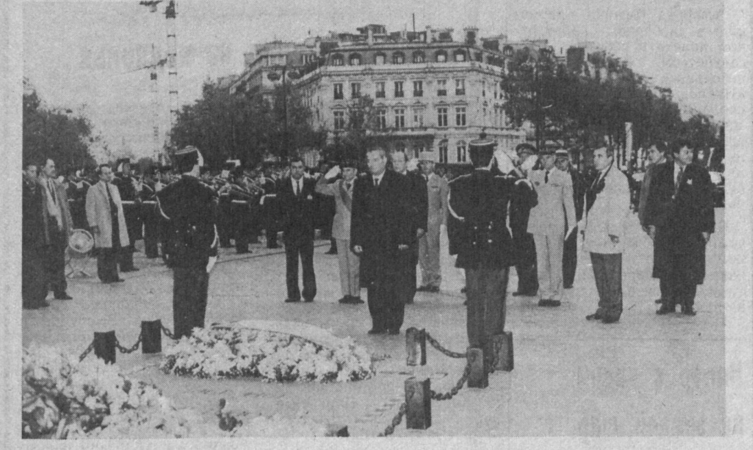
Павших на полях битвы во имя торжества мира. Позвольте выразить, господин Президент республики, уверенность в моей глубокой признательности.

Его Превосходительству господину Исламу Каримову, Президенту Республики Узбекистан