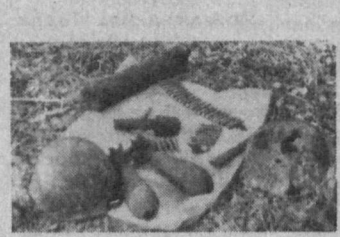
По долгу памяти