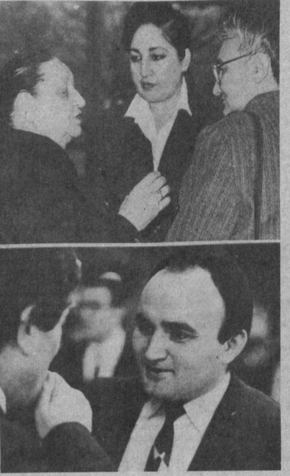
В зале заседания сессии.