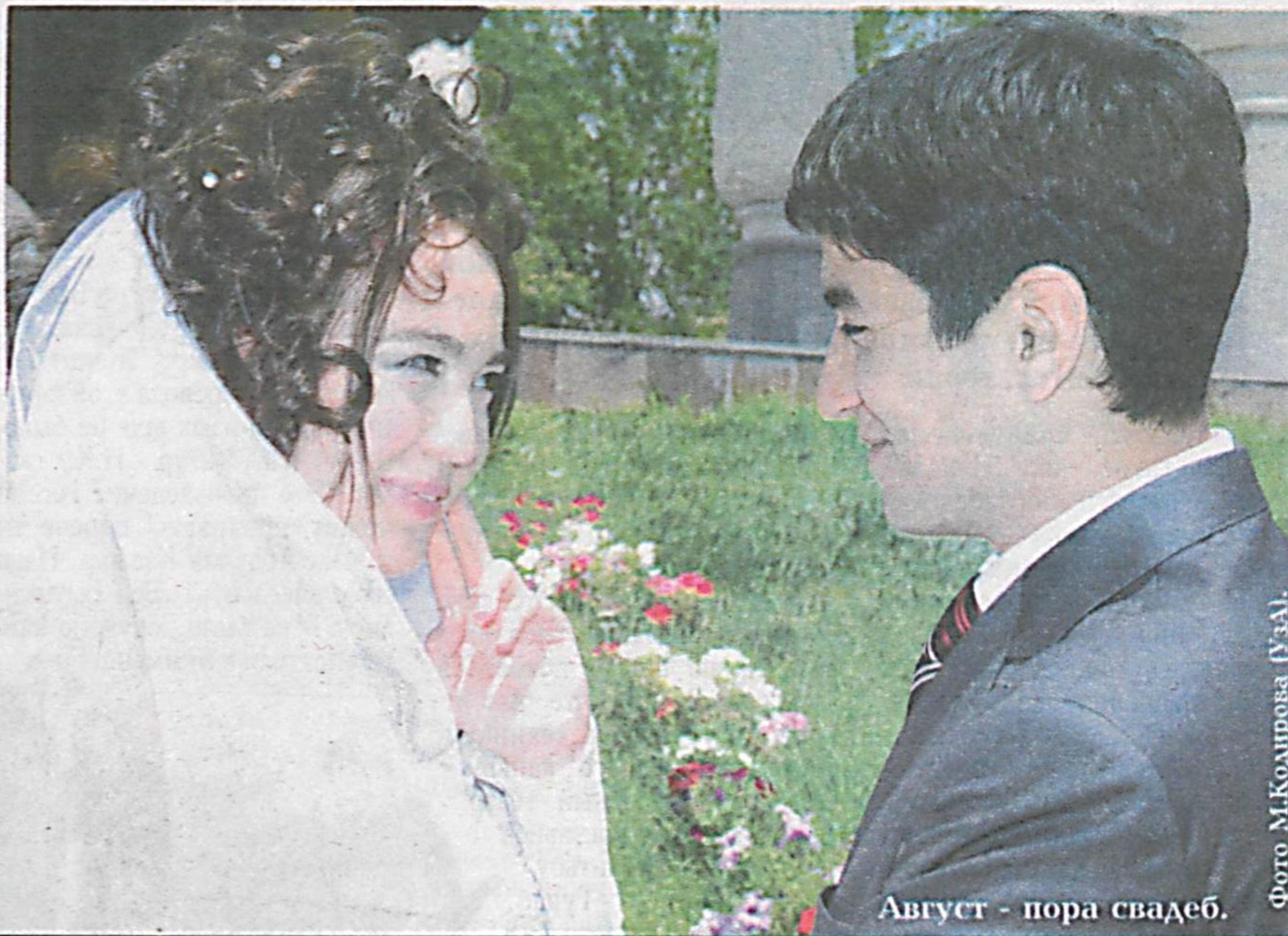
Август - пора свадеб.