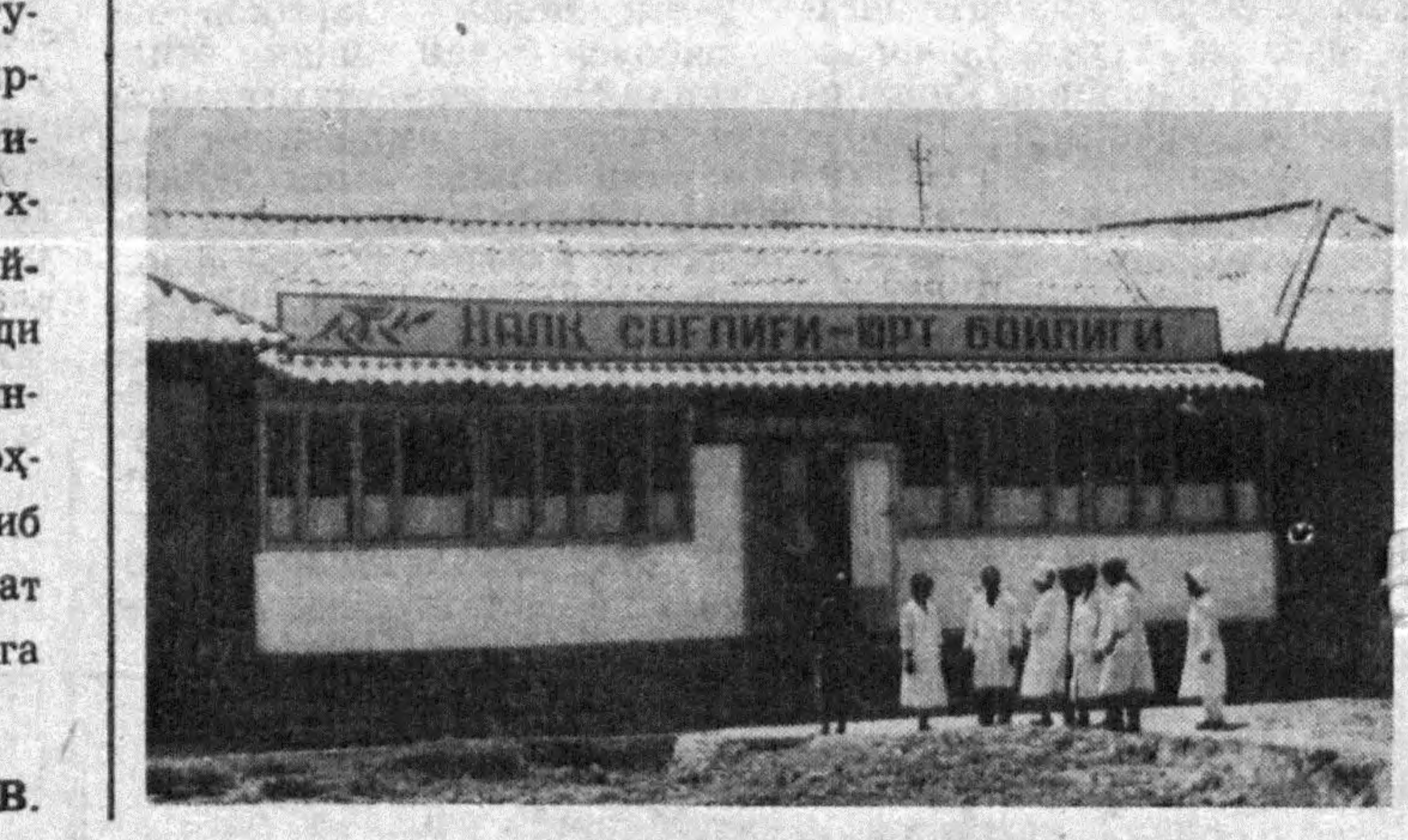
М. БОЛТАБОВЕВ олган суратлар.

Биз уни бир йилдан кейин уратиб қолдик. — Отаҳон, юрак қалай? — Миҳдай, шикоятга ўрин йўқ, — деб жавоб берди кўлимсираб.