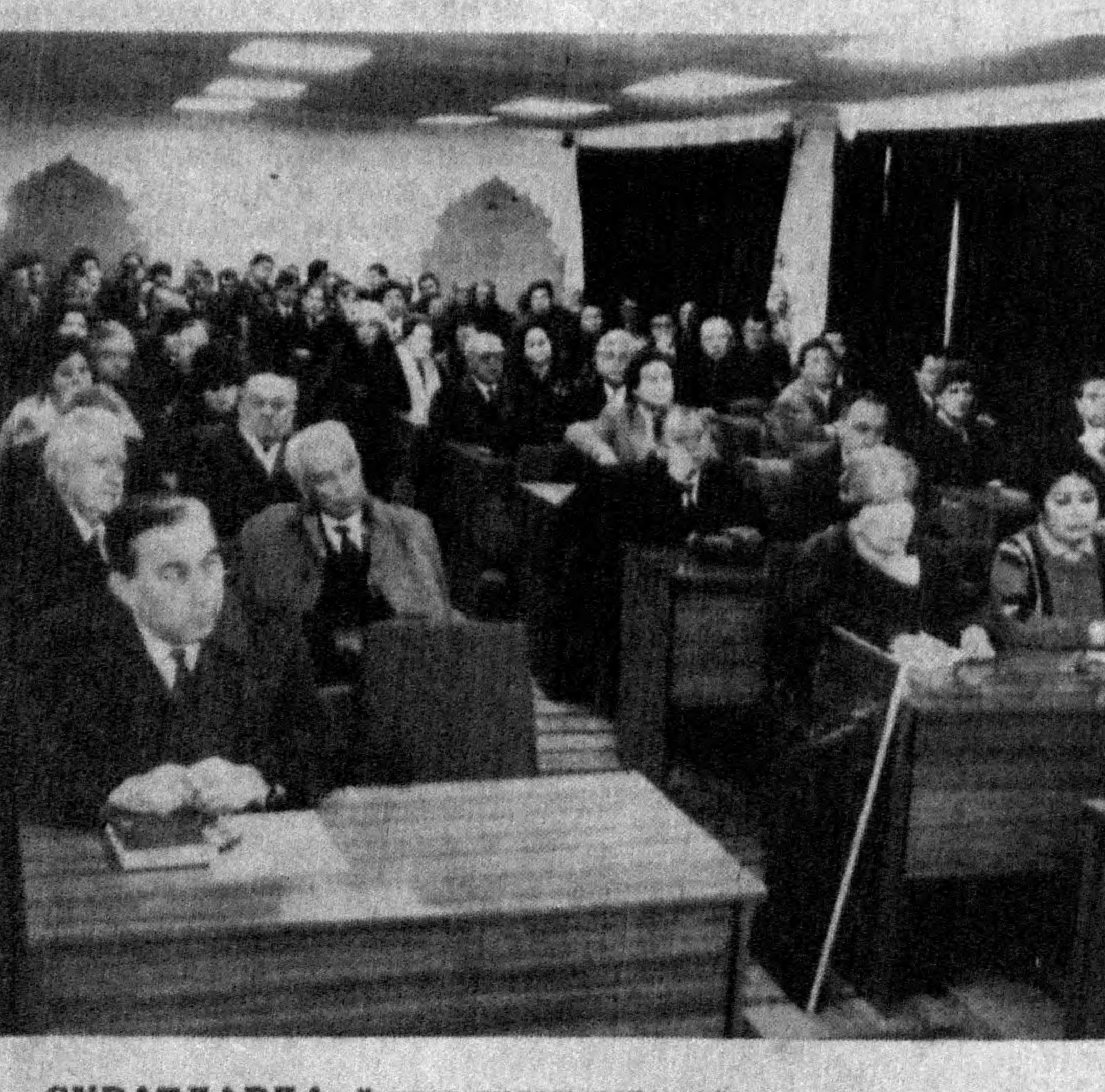
СУРАТЛАРДА: Янгиликдан лавқалар.

«Юрак! Унинг ҳақида га-зеталарда ёзадилар. Анжу-манларда гапирдилар. Мен касбиим шифокор бўлганидан кечалари у шoirларнинг илҳом манбаи ва дав-қон Баъзан унинг вазифаси ни электрон тиг ўтаб туриб-ди».