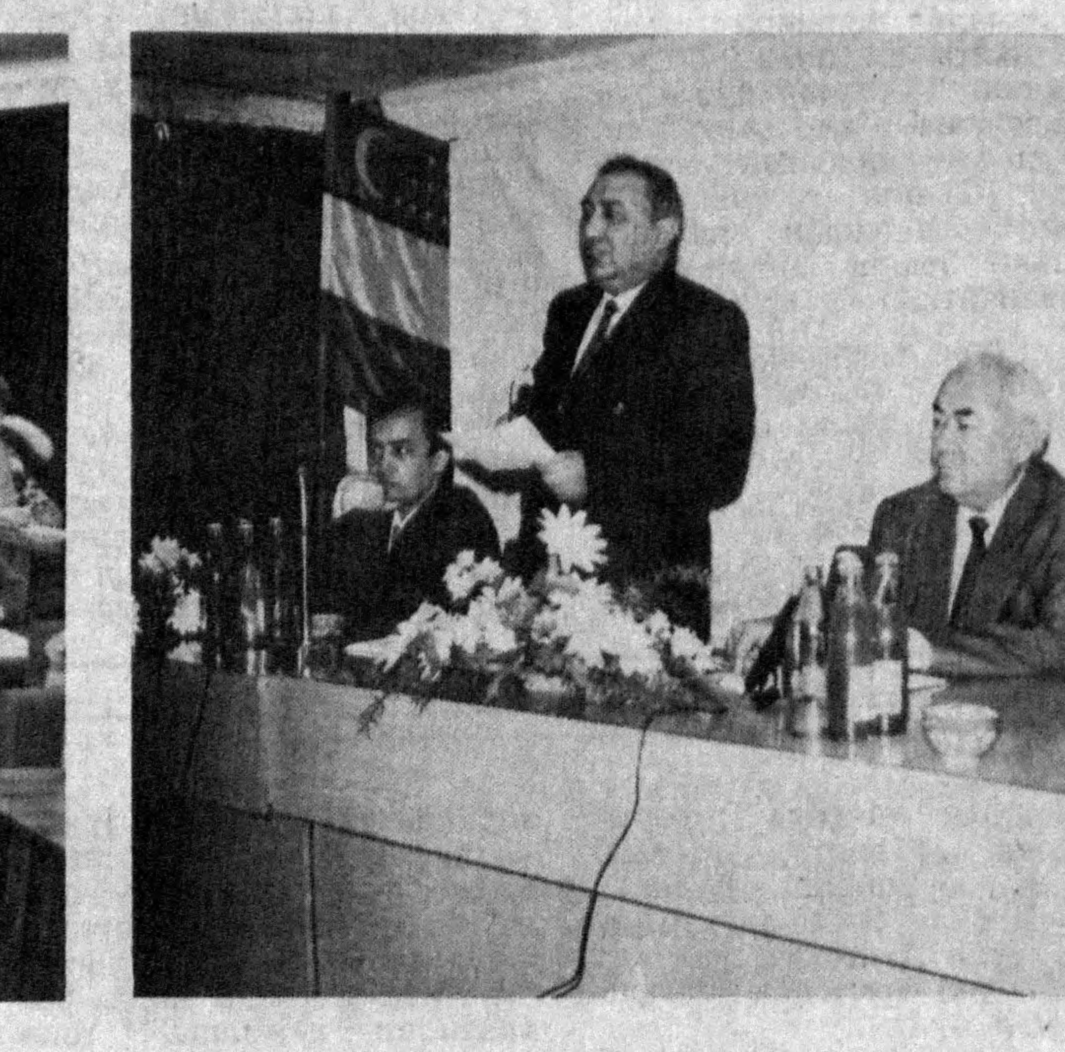
СУРАТЛАРДА: Янгиликдан лавқалар.