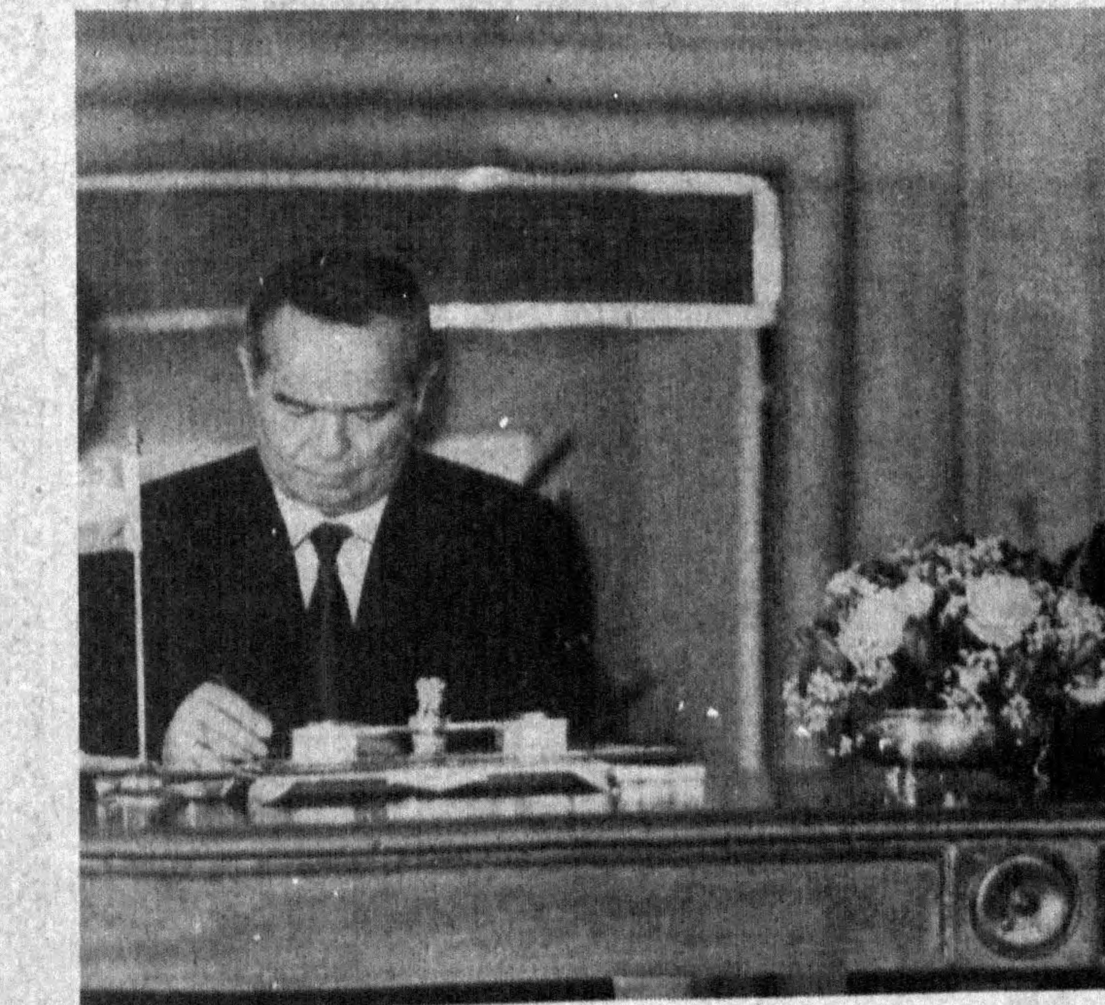
Хўжаклар имзолаётган пакт.

Ўзбекистоннинг тобора ортиб бораётган халқаро обрў-эътибори Президентимиз бошчилигидаги давлат делегациясининг Ҳиндистонга ташири бошланган даққаларда даққалардан алоҳида ҳисоб қилинган. Президентнинг муштама «Раширатпати Охаван» қасрида Ислом Каримовга кўрсатилган юксак эътиром, замбаракларнинг тантанавор гўмбур-лашлари, давлатимиз байроқларининг Ҳиндистон пойтахти марказий кўчаларини беэаганилиги бунинг таъқи қўришилари бўл-ди. Ҳиндистон Президентини И. Шарма, Бош вазири Нарасимха Рао билан уч кун мобайнида бўлган гоят диққат мулоқотларда Ўзбекистоннинг халқаро маъқега берилган юксак баҳолар, бу таширнинг жаҳон оммавий ахборот воситалари диққат-эътиборида турганлиги ички маъмури ва моҳиятини белгилади, дейиш мумкин.