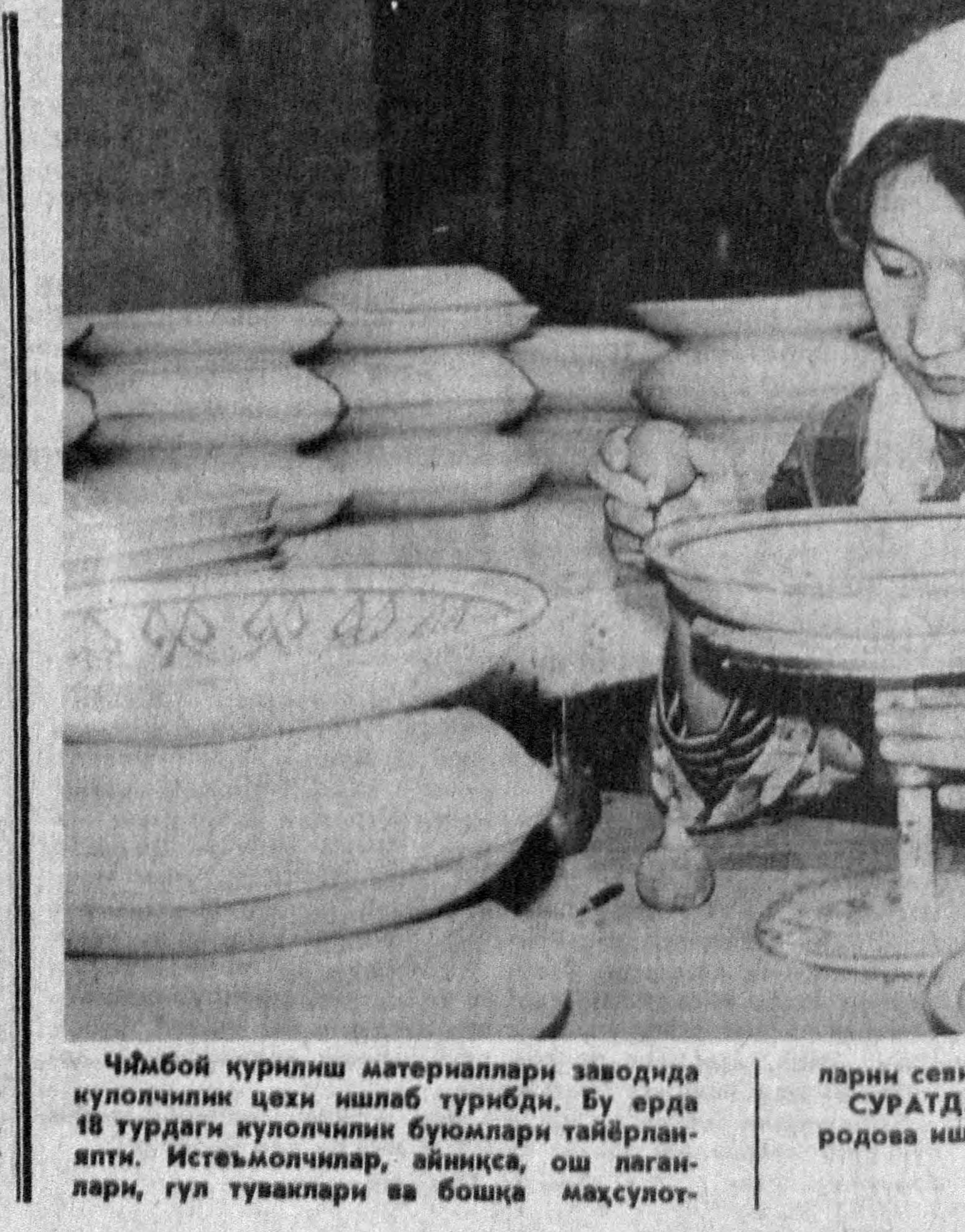
Чимбой кўрилмиш материаллари заводидagi қулочликчи цех ишлаб турирди. Бу ерда 18 турдаги қулочликчи булоқлари тайيارляпти...