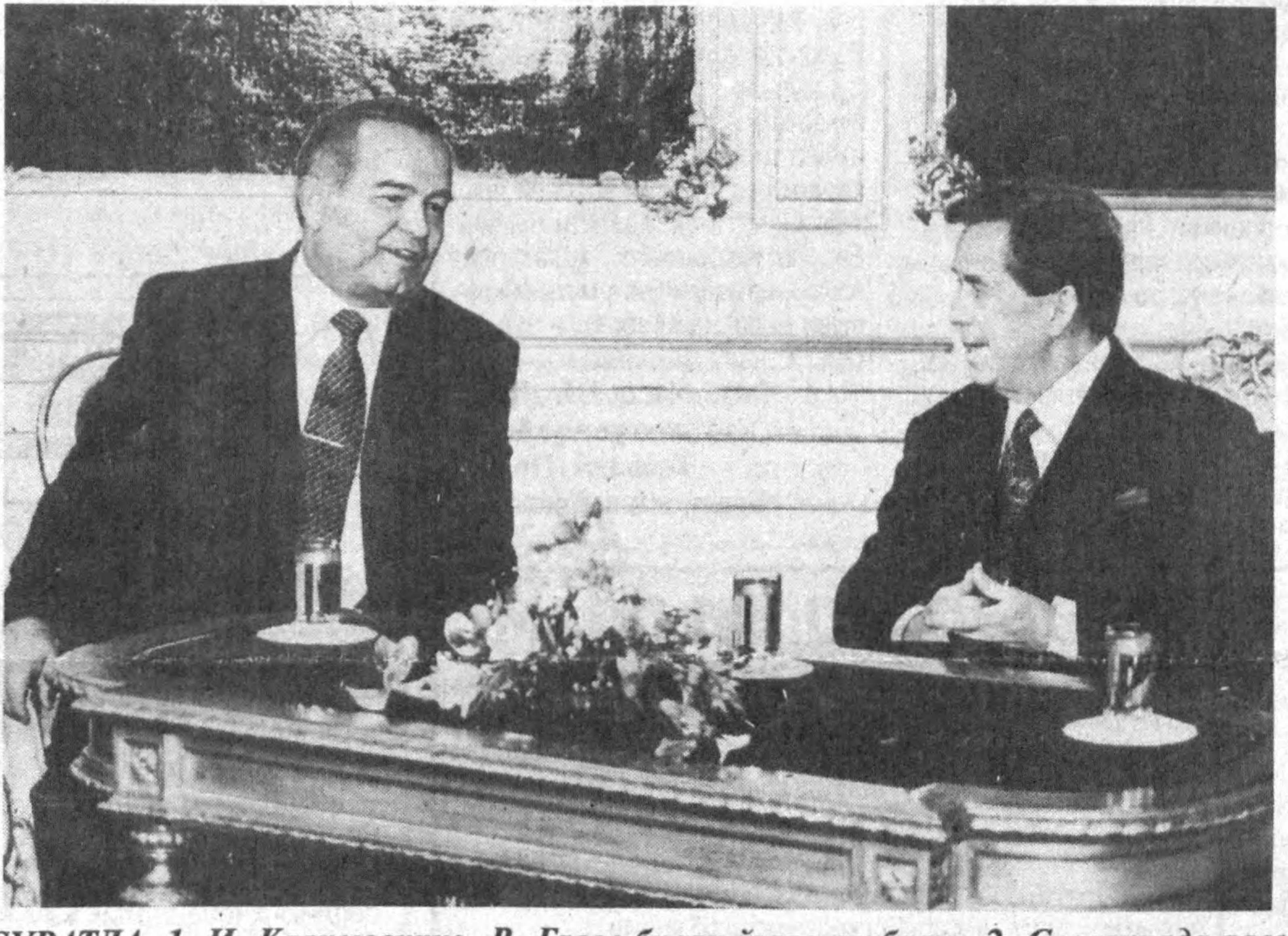
СУРАТДА: 1. И. Каримовнинг В. Гавел билан ўзаро суҳбати. 2. Словакияда расмий кузатиш маросими.

Мустақилликнинг тарихи учун бир лаҳзадек беш йиллик йўлини босиб ўтиш даврида Ўзбекистон ташқи сиёсати ва иқтисодий алоқаларида қўлга киритилган ютуқлар мамлакатимизнинг жаҳон иқтисодиётига тобора чуқурроқ кириб бориши учун хизмат қилаётир. Мамлакатимиз раҳбарининг ана шу мақсадга қаратилган 1997 йилдаги хорижа илк расмий ташрифи Чехия Республикасидан бошланди.