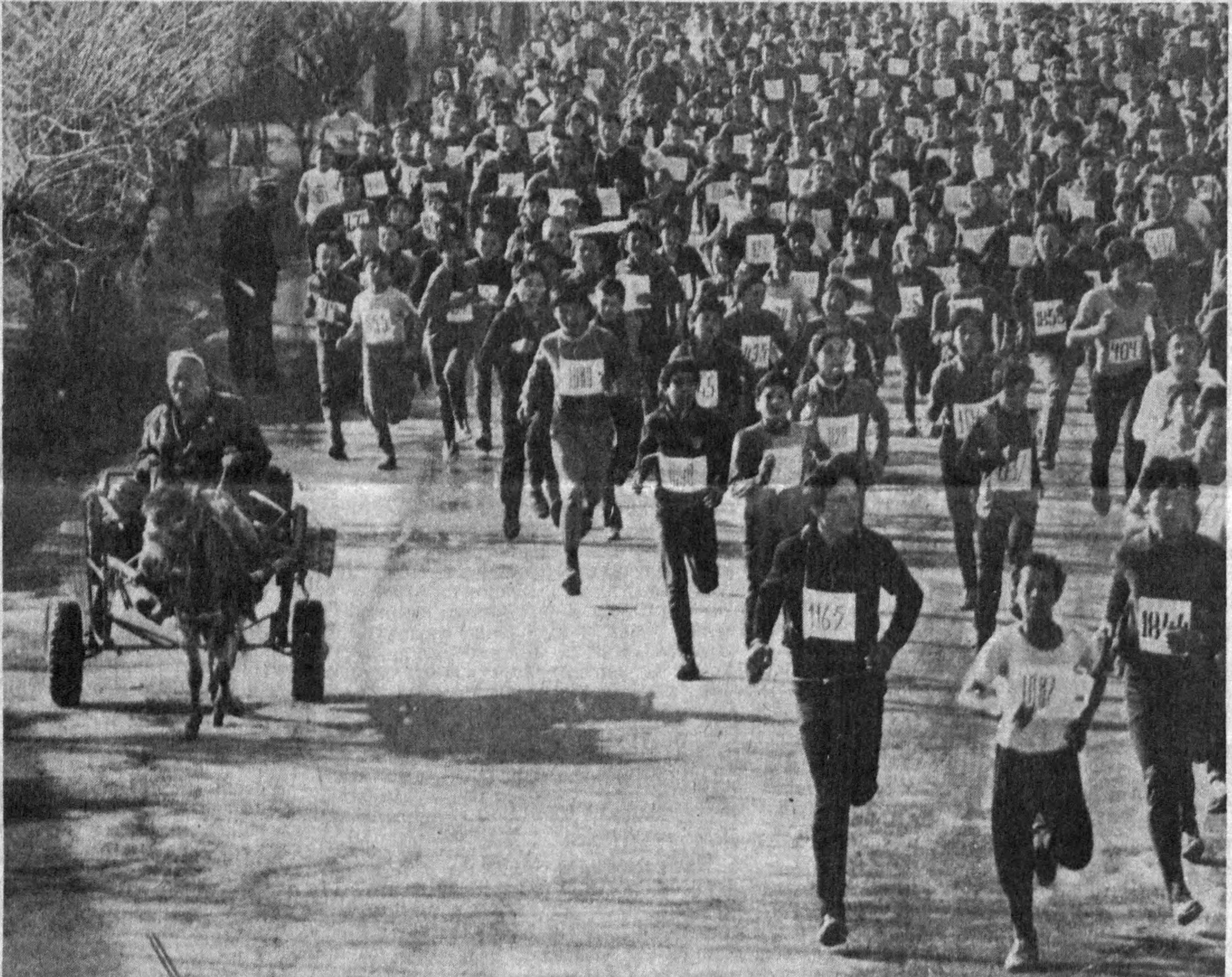
Оммавий югуриш. Ким биринчи бўларкин?

Ўзбекистон ХДП Асака шаҳар кенгаши аҳоли ўртасида jismoniy тарбия ва спортни ривожлантириш ва оммавийлигига эришиш йўлида хайрли ишлар қилмоқда.