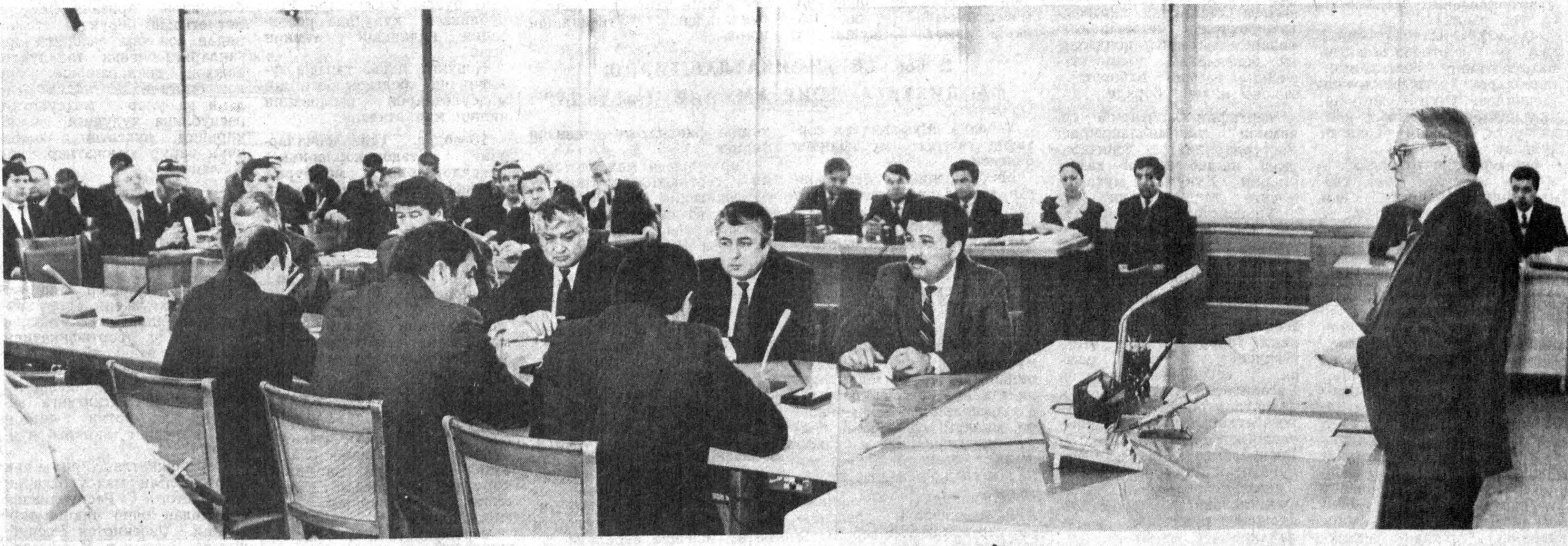
СУРАТДА: йиғилиш пайти.