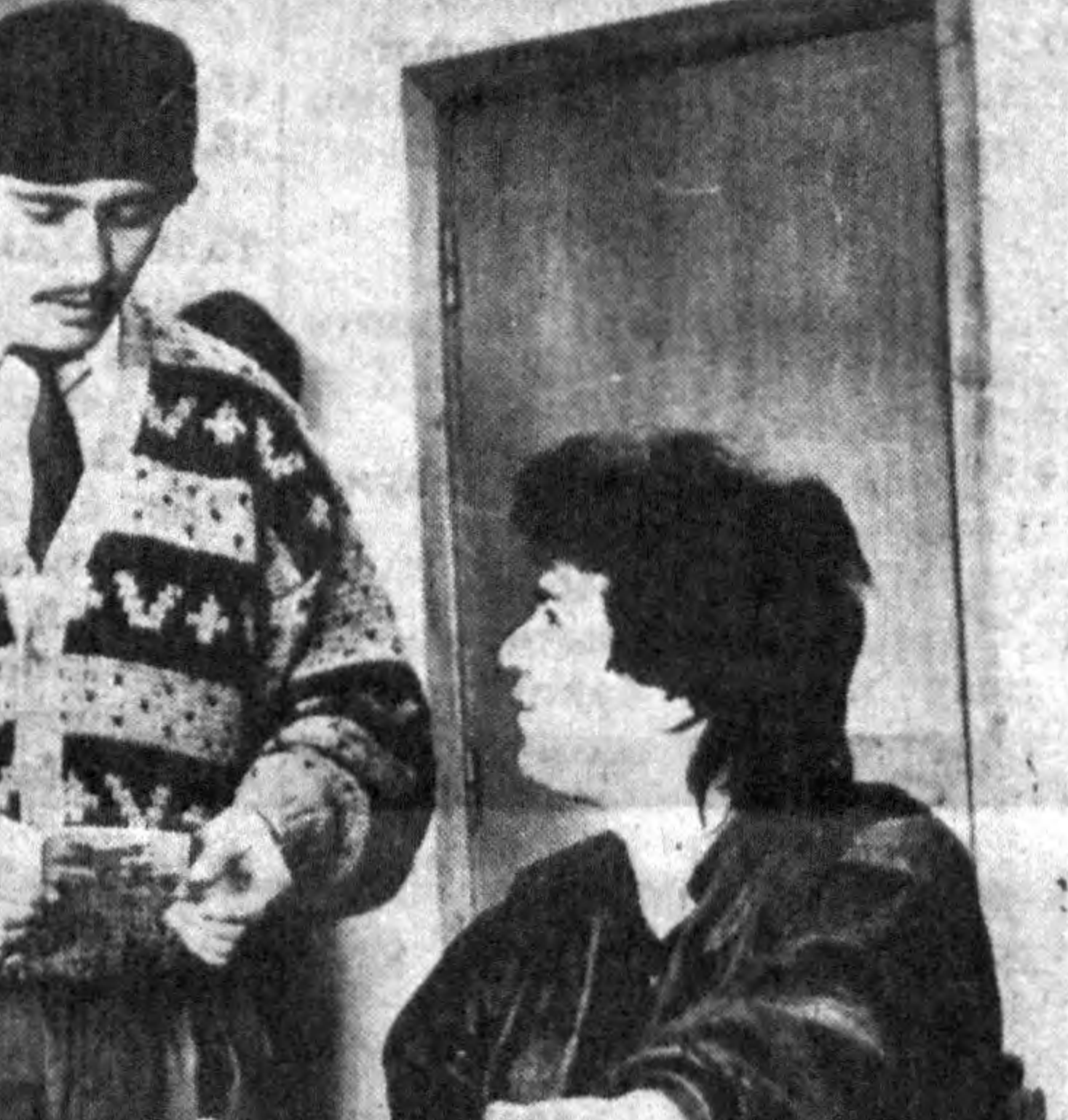
Яна бир нарсаси — қўшнчиликда кўрик-танловларнинг ўтказишчи мени ўйга солиди. Уларнинг дастурларига, қишлоқларини аниқлаш ва баҳолашга эътирос билдирмаман. Лекин бир замонлар бизнинг халқимиз талантил ҳоғизларини кўриқлар орқали танила олмаган-ку?

Рост, бу қутлуг бўсагадан ҳатлаб ўтишиңгиз қанчалар осонмаслиғини сезанман. Авваллари ўйлардим, бу артистлар беш-олти та қўшнчилик айтса бўлди, жуда тез танилиб кетади, деб. Бошдан ўтаятти ҳозир. Жу-дула нозик ва машаққатли йўл экан. Ўтганларингиз руҳига сиғиниб, бутун қўшнчилик санъатимизнинг бешингизини тебратаятганлар билан ёнма-ён туриб ижод қилаймиз.