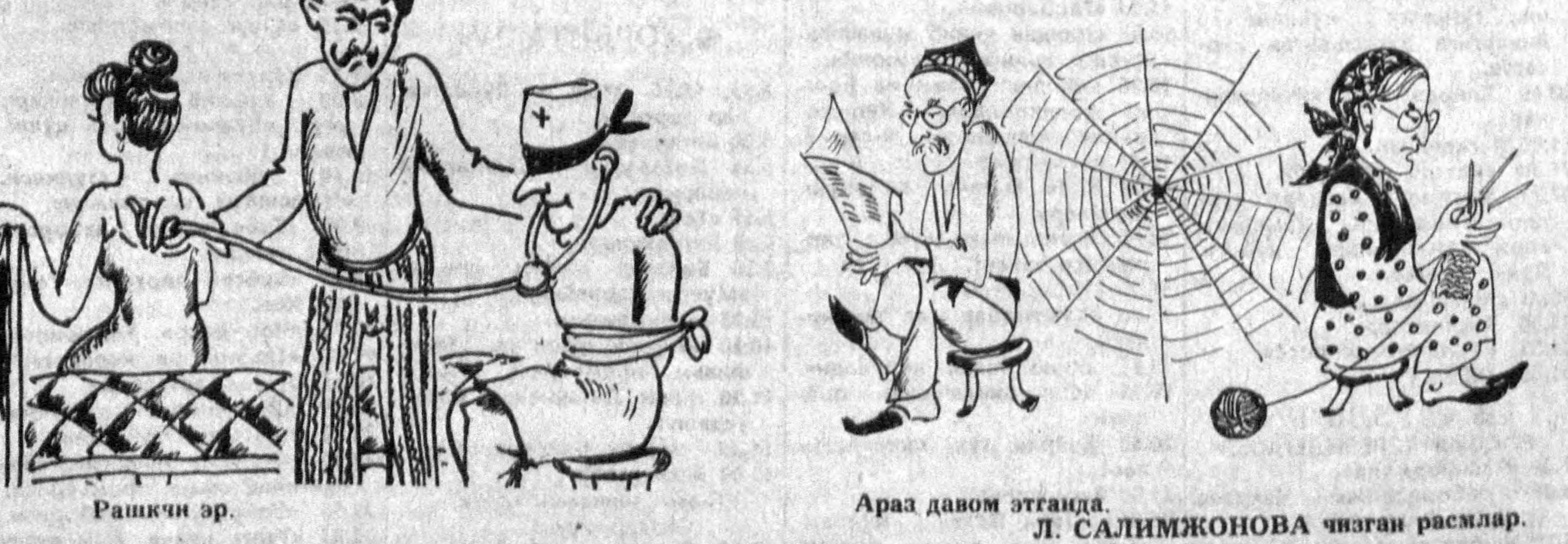
Арааб давом этганда. Л. САЛИМЖОНОВА чизган расмлар.