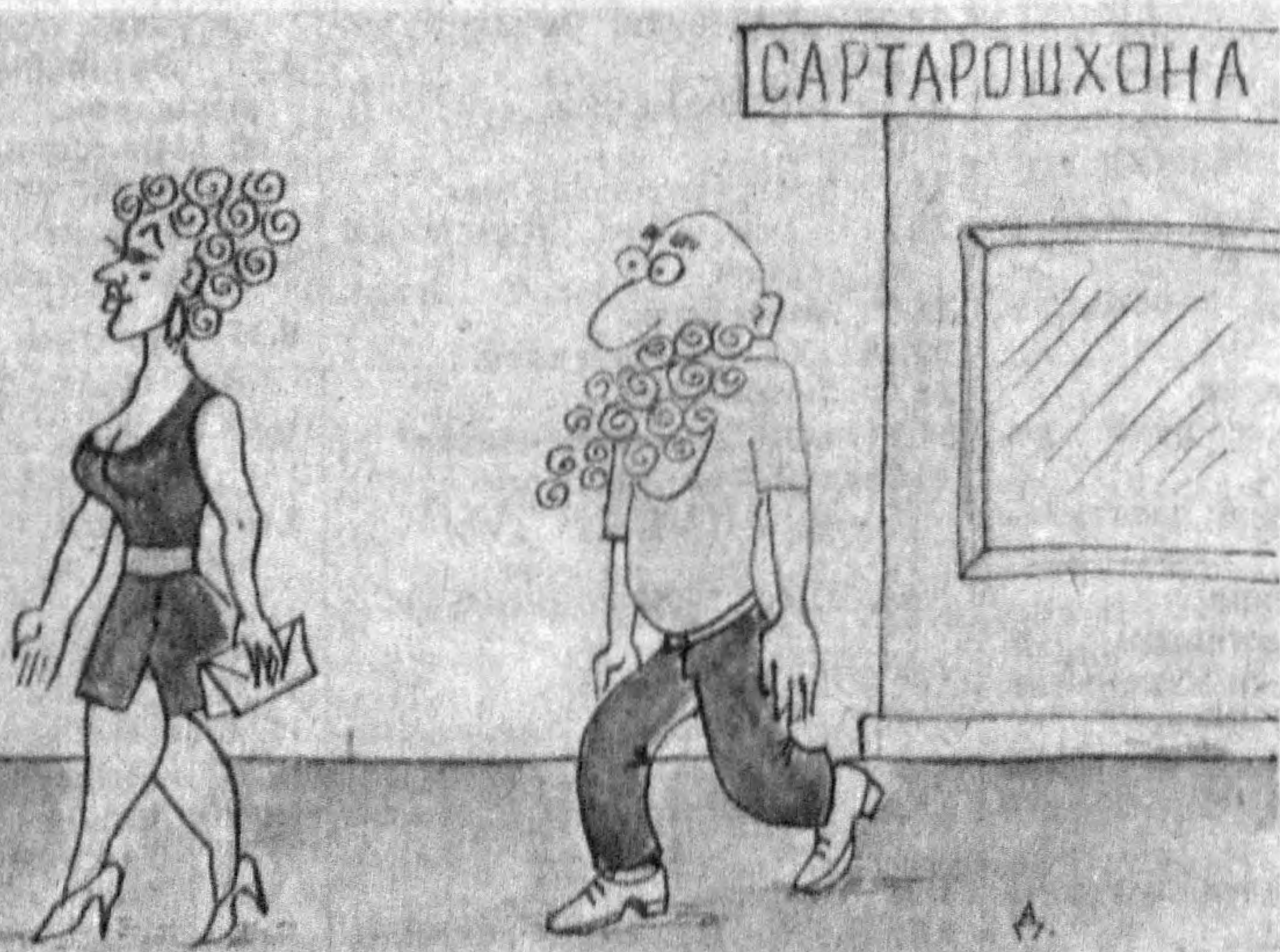
Изоҳнинг ҳолати йўқ.