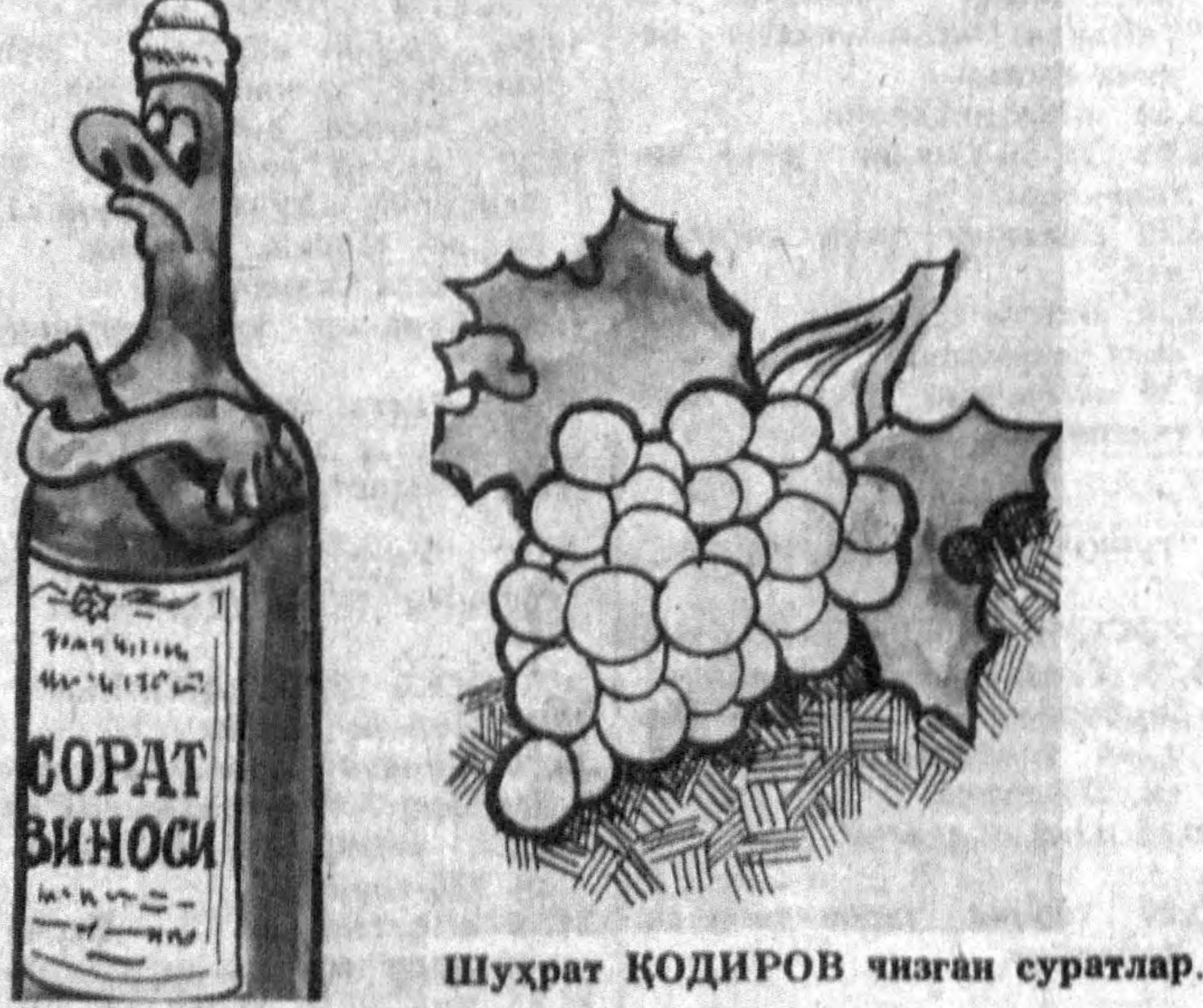
Шухрат ҚОДИРОВ чизган суратлар.