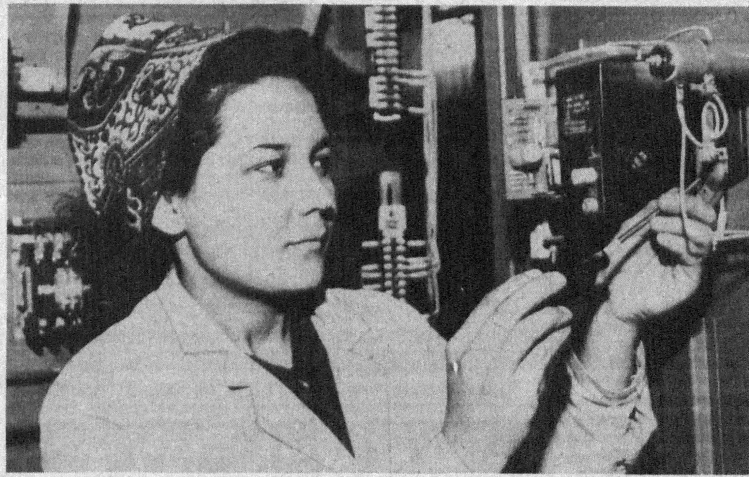
ҚўЛИНГИЗ ТОЛМАСИН, ЎЗБЕК АЁЛИ.