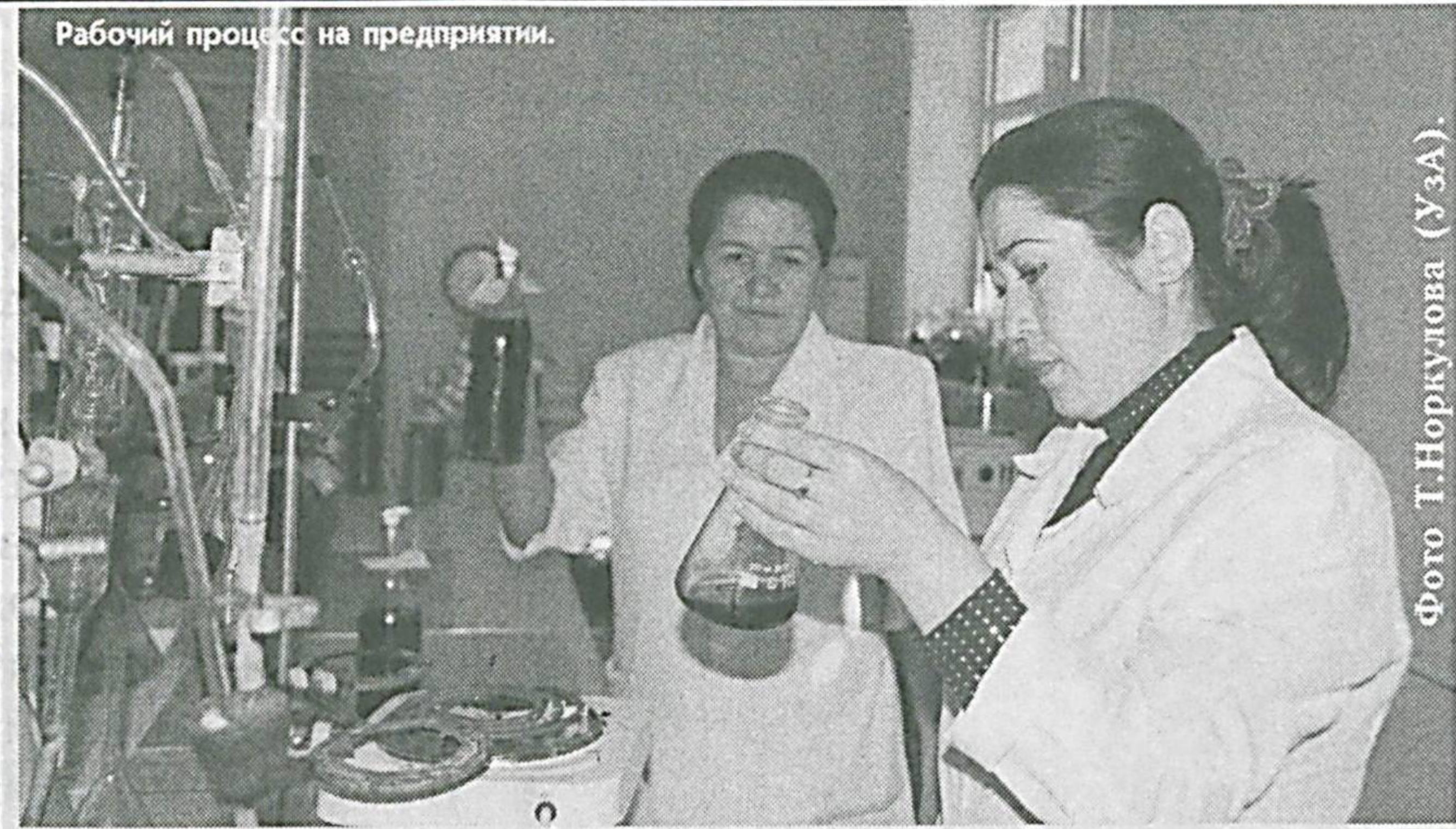
Узбекско-британским совместным предприятием ООО "Адаг агро инвест" Тайласского района Самаркандской области планировалось заготовить в нынешний сезон 10 тысяч тонн винограда. Сейчас этот показатель перевыполнен с превышением в 200 тонн. На четырех линиях идет обработка двух сортов винограда. Готовая продукция отправляется на экспорт.

Зебо Хайдарова. Соб. корр. "Правды Востока". Сырдарьинская область.