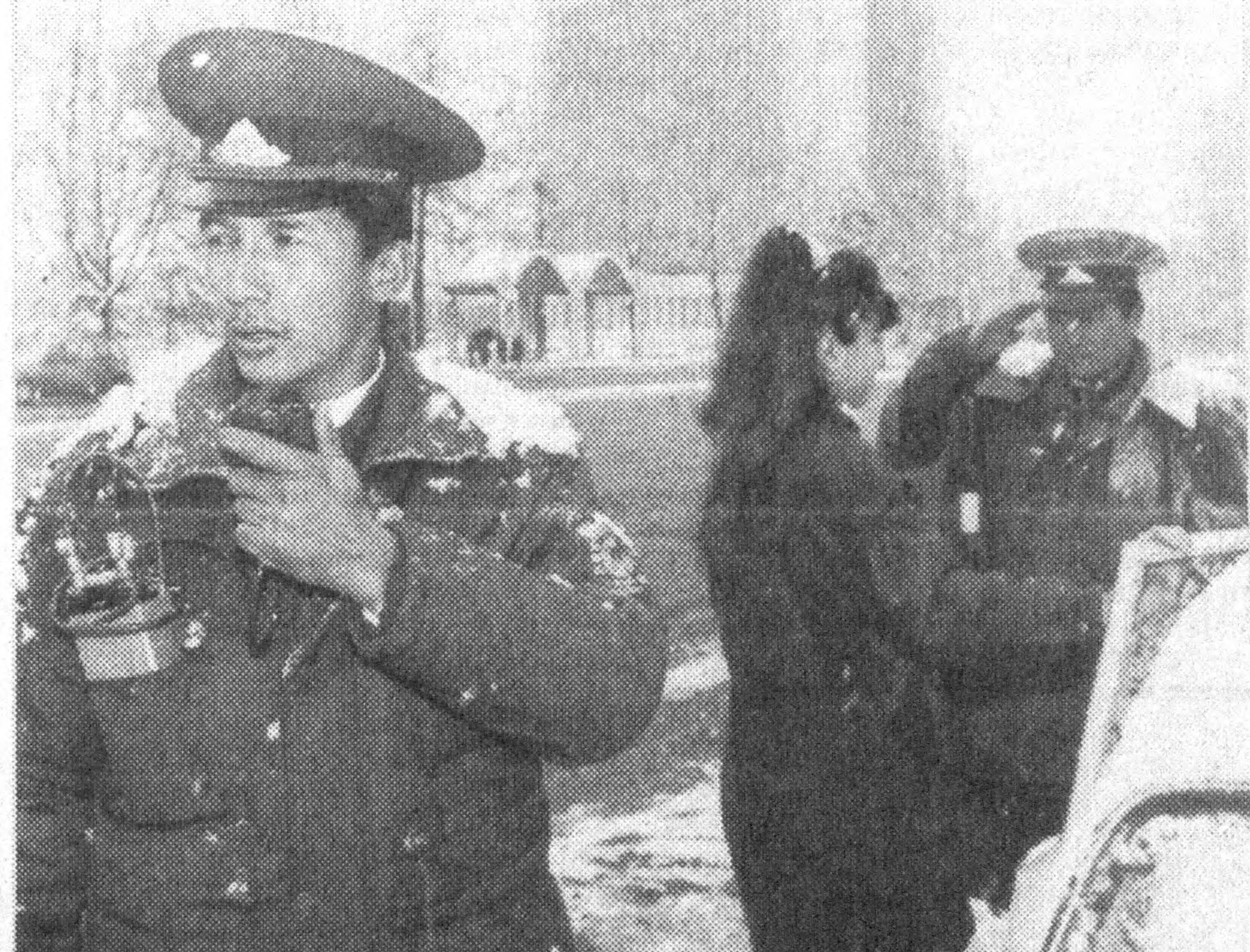
Ёмғирда ҳам, қорда ҳам йул посбонлари ҳушёр.

Куба раҳбари Фидель Кастро Голливуддаги энг ёрқин «юлдузлари»ни бир неча кун Кубада синара чекиб, дам олишга таклиф этди, деб ёздади «Таймс» газетаси.