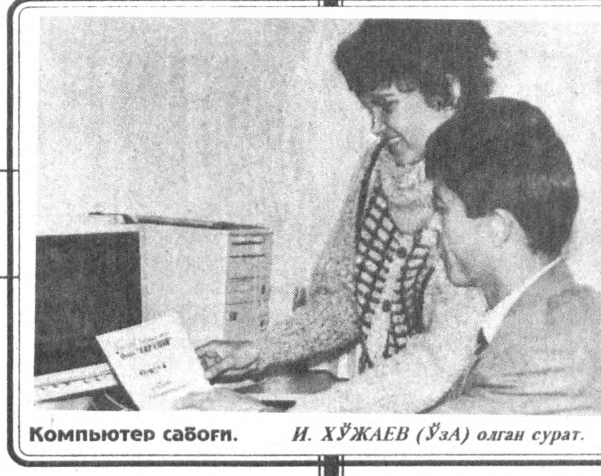
Компьютер сабоғи.