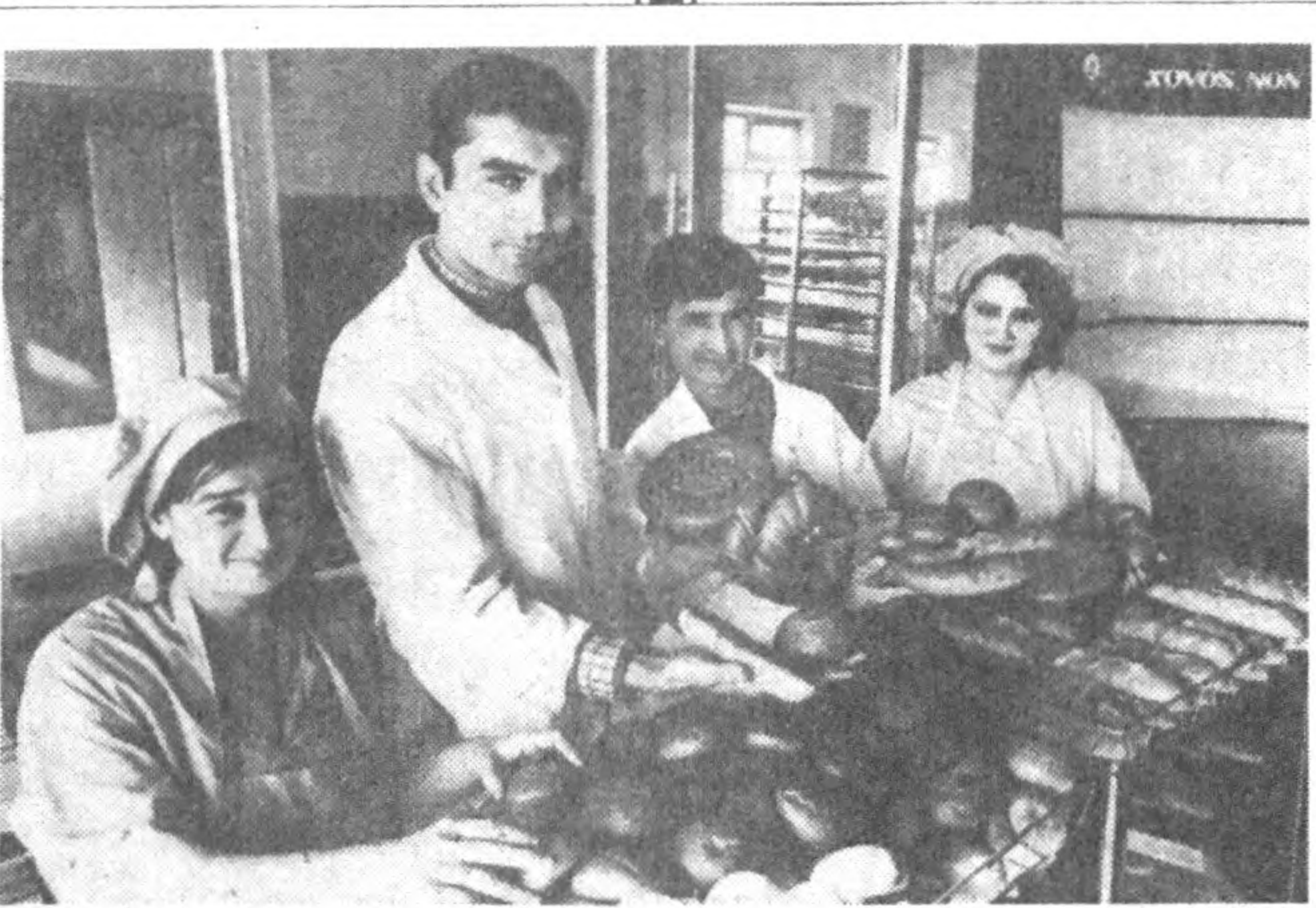
Нониниз сероб — юнглимиз тўқ.

СИРДАРЁ. Вилоят қишлоқ ва сув хўжалиги бошқармаси тасаруфидagi юзга яқин жамоа ва ширкат хўжалигининг раҳбарлари аттестация, яъни малага синовида ўтказилди. Бу тадбирда вилоят ҳокимининг биринчи ўринбосари Х. Янгибоев қатнашди. Хуллас хўжалик раҳ-