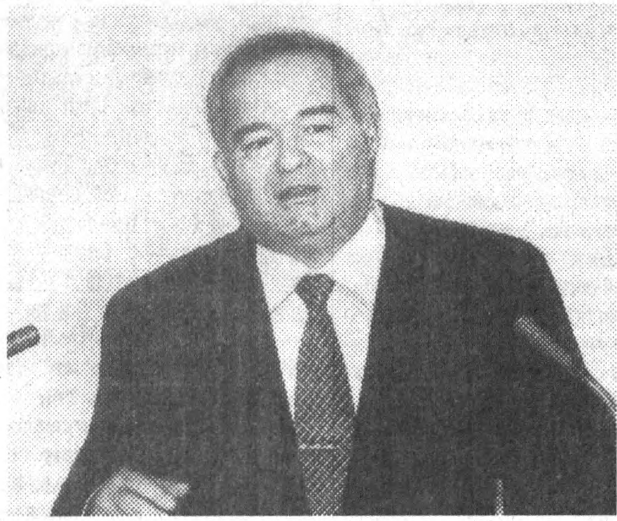
СУРАТЛАРДА: йиғилиш пайти.

26 февраль куни Президент Ислам Каримов раислигида республика Вазирлар Маҳкамасининг 1996 йилда Ўзбекистонни ижтимоий-иқтисодий ривожлантириш яқунлари ҳамда 1997 йилда мамлакатимизда амалга оширилаётган иқтисодий ислохотларнинг устувор йўналишларига бағишланган мажлиси бўлди. Унда вилоятлар ва Тошкент шаҳри ҳокимлари, вазирликлар, давлат қўмиталари, концернлар, корпорациялар, уюшма ва идораларнинг раҳбарлари иштирок этди.