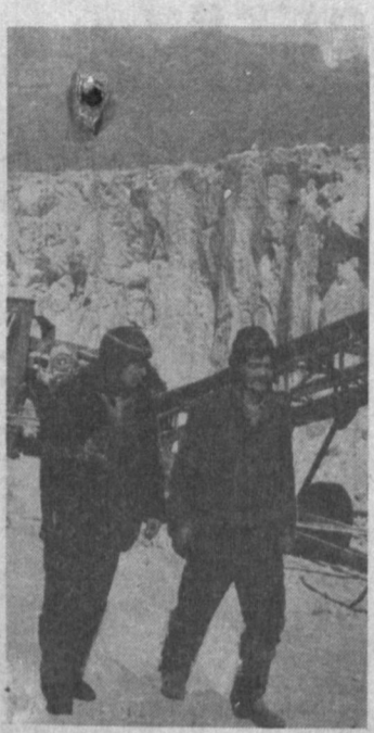
В Ходжаканде самые крупные месторождения соли в республике. Здесь ежегодно заготавливается 500 тысяч тонн технической соли. С прошлого года в Ходжаканде стали производить пищевую соль.

ПРИМЕЧАНИЕ: разернутий ассортмент указанных товаров определяется госсоциальной «Узбэсавдо» и Узбекбизнесу по согласованию с Министерством финансов и Государственным налоговым комитетом.