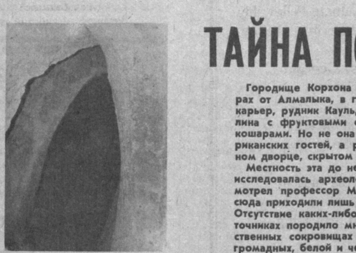
Корхона стоит на правом берегу сая, у слияния его с небольшой речкой. Стратегическое положение очень выгодное — мимо лежит путь в горы. Расположенное на трех возвышенностях, городище к тому же с двух сторон практически неприступно. В одном из холмов — диаметром около пятидесяти метров — находится подземные помещения.

Это довольно просторные комнаты, соединенные коридорами и переходами. Основных входов два: с востока и с севера. Самый крупный зал под землей — размером восемнадцать на четыре и высотой семь метров — до войны был мечетью для немногочисленных паломников. От него прорыты ходы в другие помещения. Вдоль коридоров множество ниш — крупных и небольших. Между эта-