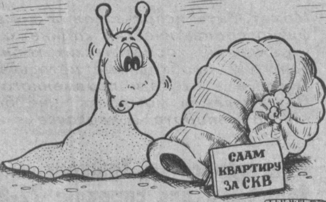
Рис. А. МАРКЕЛОВА.