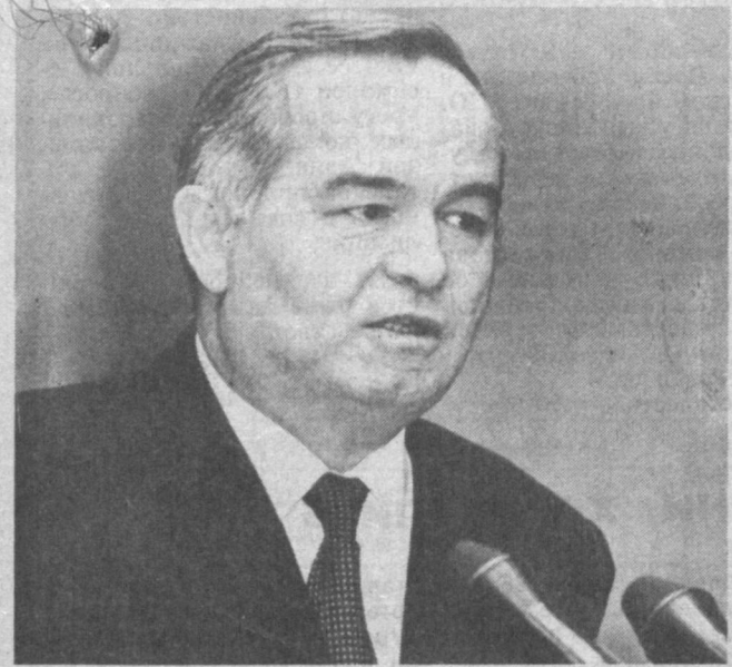
Во время встречи.

По данным облгоспрома, нынче хлопчатник разместится на 1.505,7 тысячи гектаров, что на 161 тысячу меньше прошлогодней площади. Тонковолокнистые сорта займут 55 тысяч гектаров, в основном в Сурхандарьинской и Кашкадарьинской областях. В «боевой» готовности техника, в посевной будет участвовать свыше 21 тысяч сеялок. Повсеместно идет подготовка земель: нарезка борозд, боронование, планировка. Согласно прогнозу Гидрометецентра республики, температурный режим как в воздухе, так и в почве позволяет вести сев хлопчатника почти во всех областях, кроме Каракалпакстана. Засеяны первые гектары в хозяйствах Джаркунганского, Кумуруганского, Термезского, Узуского и Ангорского районов Сурхандарьи. Р. КИМ. Ведущий специалист управления хлопководства главного земельного Минсельхоза республики.