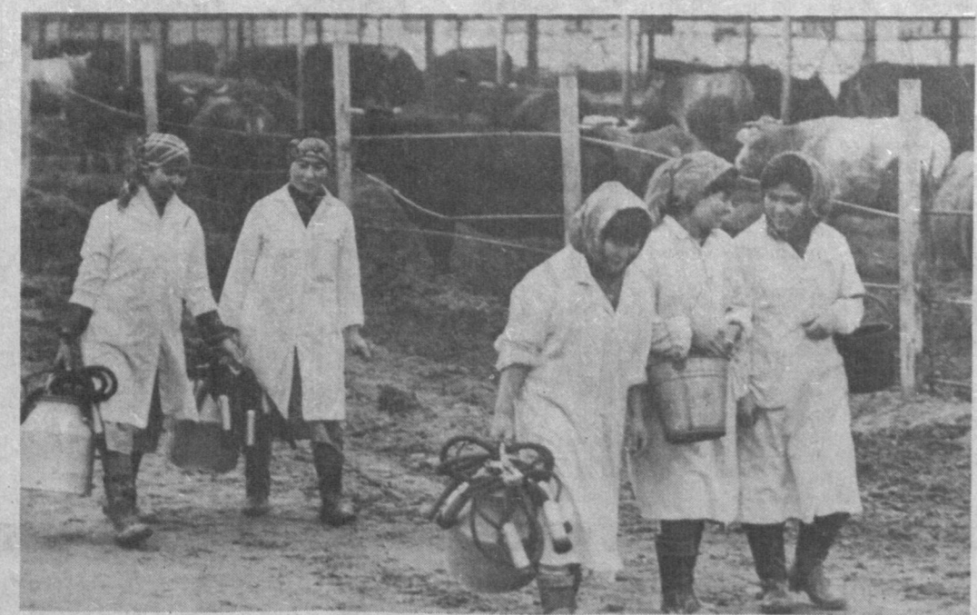
В нынешнем году животноводы Задарьинского района Наманганской области обещали продать государству 6,780 тонн молока, более тысячи тонн мясопродуктов, 800 тысяч штук яиц, 258 центнеров шерсти. Успешно провели зимовку скота животноводы общественного хозяйства имени Навои.

Е. ЕФИМОВ. Обозреватель «Правды Востока».