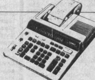
ВЫСОКОПРОЧНЫЙ КАЛЬКУЛЯТОР С ПРИНТЕРОМ DR-8620