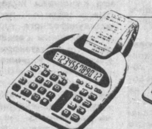
КОМПАКТНЫЙ КАЛЬКУЛЯТОР С ПРИНТЕРОМ HR-170L