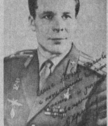
На фотопроизведении: портреты Ю. Гагарина и Е. Хрунова, подаренные им автору.