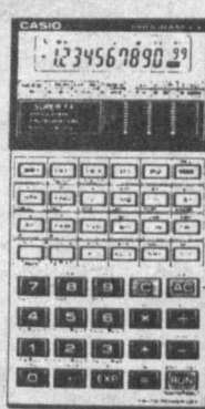
УЧЕБНЫЙ КАЛЬКУЛЯТОР fx-82 SUPER