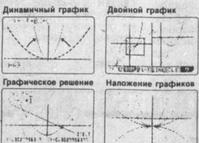
Динамичный график, Двойной график, Графическое решение, Наложение графиков