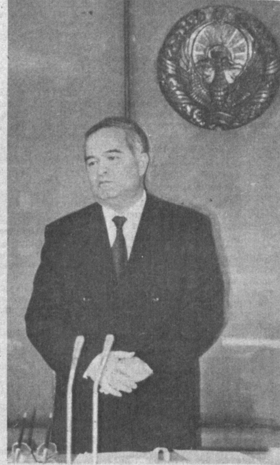
Участники торжественного собрания направили письмо в адрес Президента Республики Узбекистан Ислама Каримова.

начался сев хлопчатника. В это время специалисты по гидрометеорологии должны рекомендовать для проведения посевной кампании наиболее благоприятное время, отвечать за правильность своих прогнозов. Что толку, если мы посеём хлопчатник, а ливневые дожди смоят посевы. Сейчас было сказано, что ликвидировано свыше 300 точек по наблюдению за погодой в интересах сельского хозяйства. Их необходимо быстро восстановить. Есть такая поговорка: «Скупой платит дважды». Неразумно в конце концов потерять миллиарды ущерба, чтобы сэкономить миллион. Ведь вовремя затраченные средства могут принести впоследствии тысячекратную пользу.