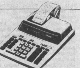
НАСТОЛЬНЫЙ КАЛЬКУЛЯТОР С ПРИНТЕРОМ FR-3400