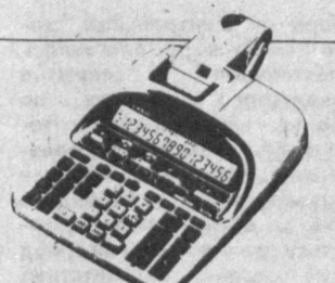
ВЫСОКОПРОЧНЫЙ КАЛЬКУЛЯТОР С ПРИНТЕРОМ PJ-160L