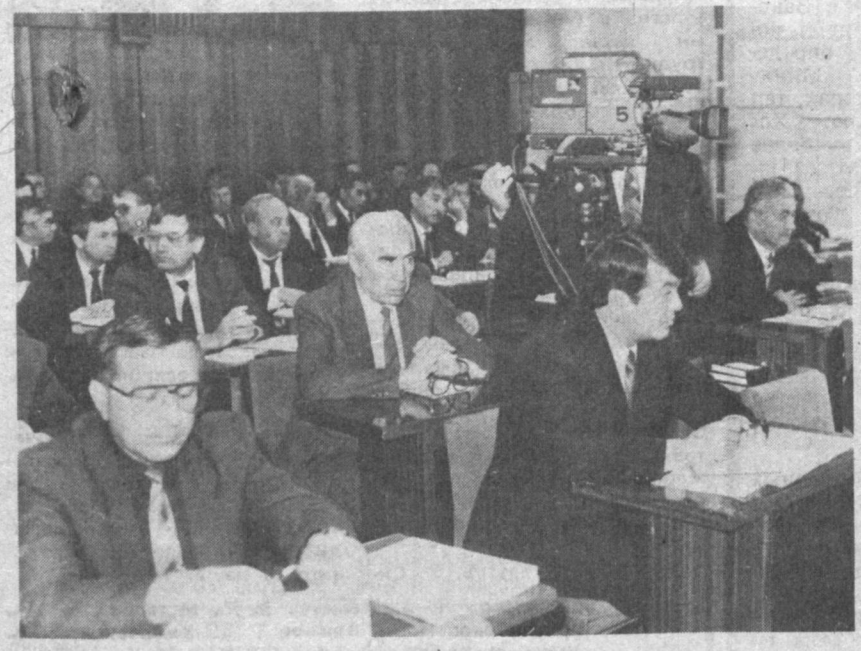
НА СНИМКАХ: во время заседания.