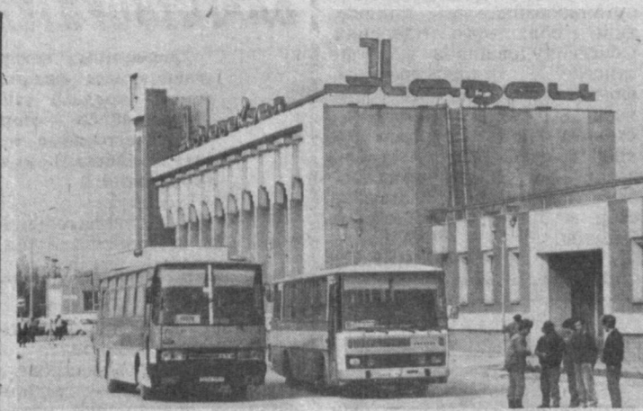
Каждый день в Навои приезжает множество гостей. Ежедневная пропускная способность городского автовокзала — 7 тысяч пассажиров. На различных направлениях курсирует 150 городских автобусов и 45 пригородных. НА СНИМКЕ: здание автовокзала.