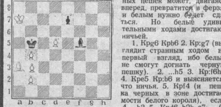
1. Крg6 Крb6 2. Крg7 (выглядит странным ходом на первый взгляд, ибо белые не смогут догнать черную пешку). 2...h5 3. Крf6h4 4. Крb5 Крb6 и выясняется, что ничья. 5. Крf4 (и пешка черных в зоне досягаемости белого короля), если 4...h3 5. Крb6 h2b7 (и пешки одновременно превращаются в ферзя, опять ничья).

Есть позиции, взглянув на которые, вы сразу же определите результат. Но это кажущаяся легкость. Проиллюстрируем несколько позиций, где в беззащитных на первый взгляд положениях удивительные рейды королей наступают «неудержимые» пешки, и исход партии оказывается другим.