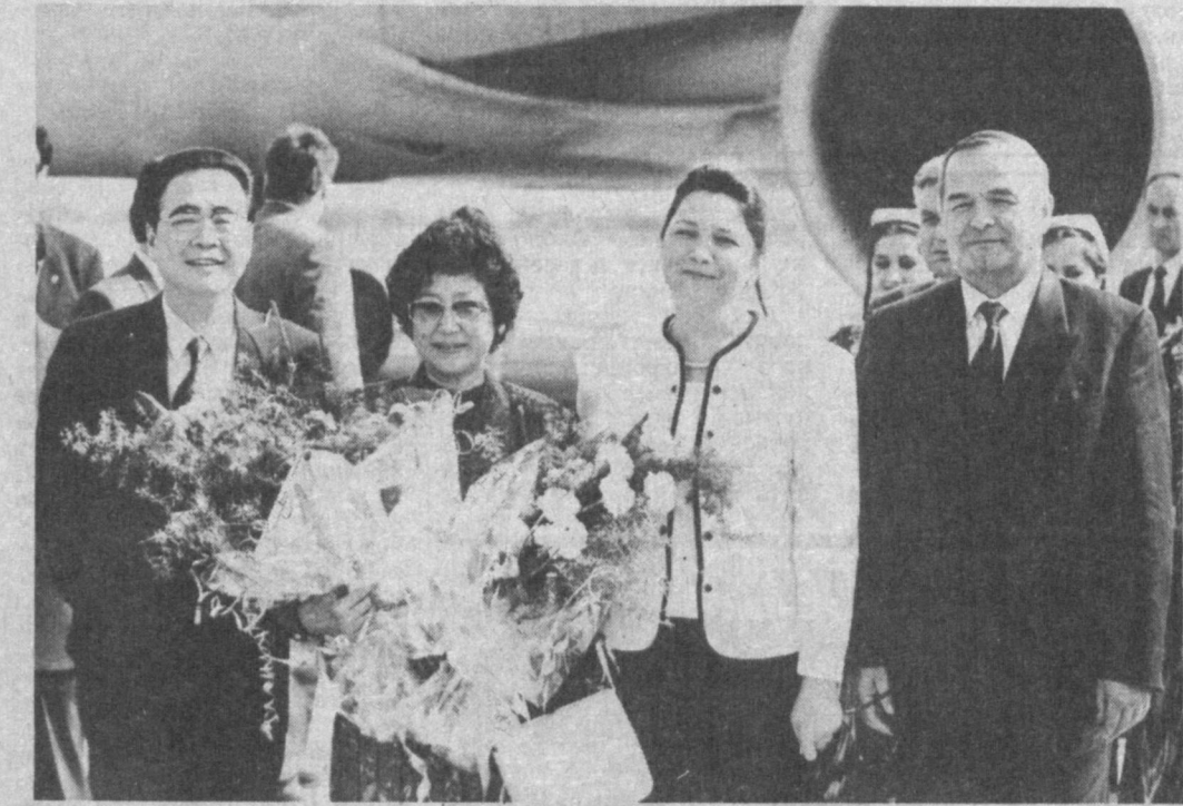
НА СНИМКЕ: проходы в аэропорту.