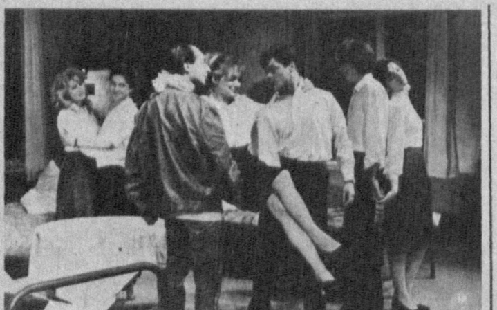
Режиссер Ташкентского государственного академического драмтеатра имени Максима Горького В. Гравоский поставил спектакль «Крыша» по пьесе Александра Галина. Спектакль, посвященный студенческой жизни 70-х годов, тепло встречен зрителями. НА СНИМКЕ: сцена из спектакля «Крыша».