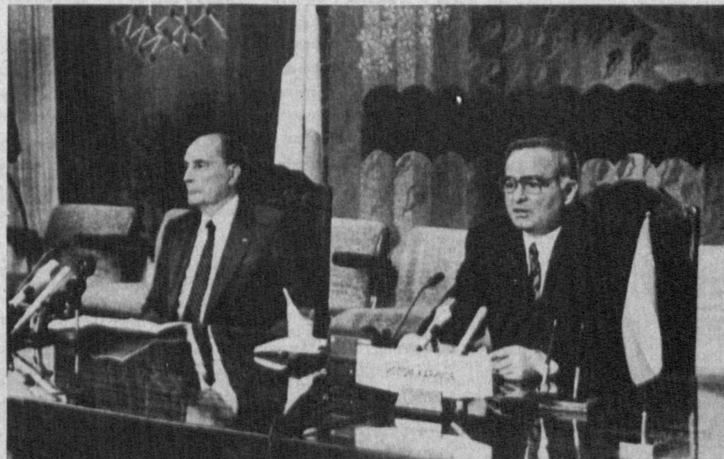
Во время пресс-конференции.