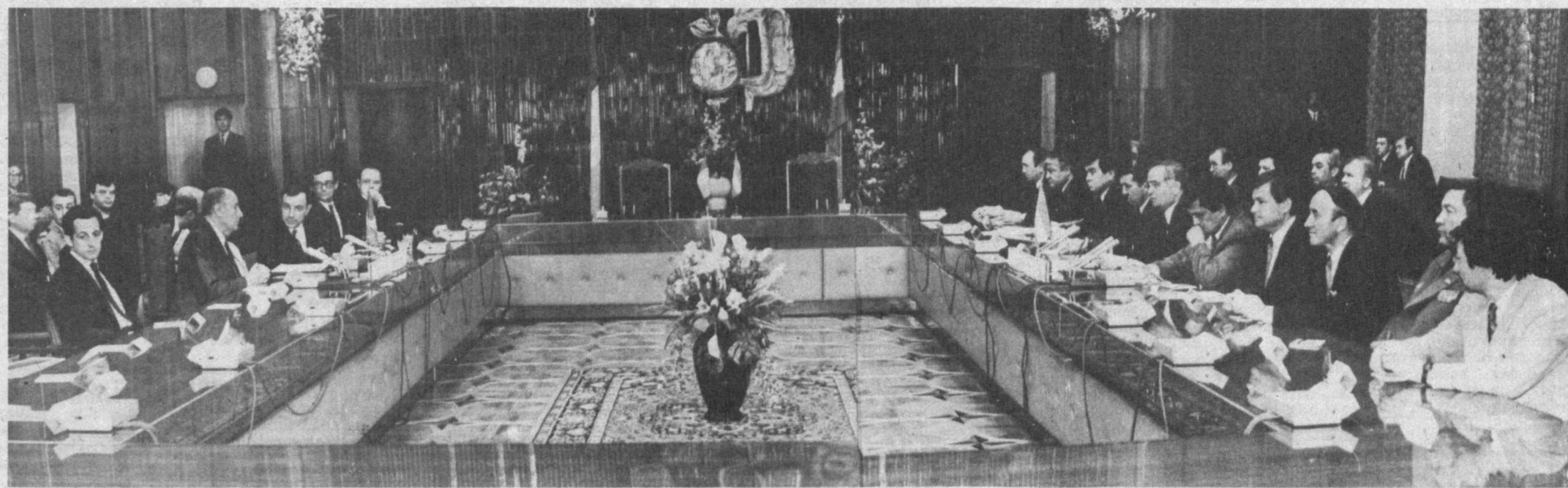
Во время переговоров.