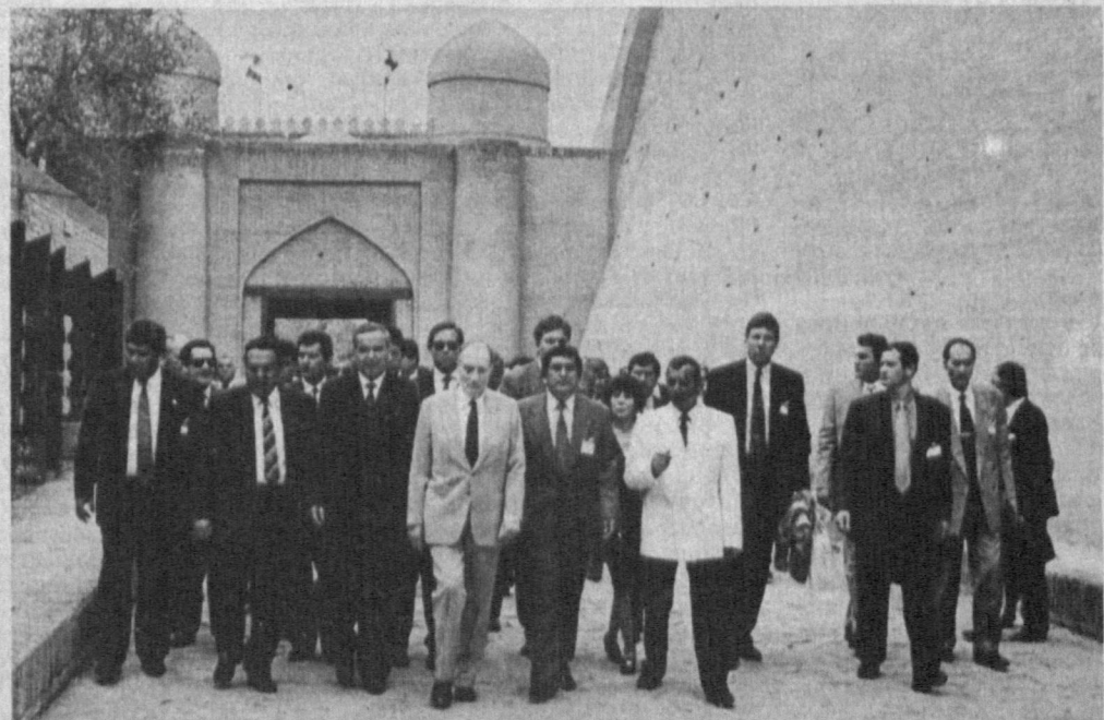
Посещение хорезмской земли.

Г-н Франсуа Миттеран с большим уважением говорил о великом поэте. Приступившие здесь жители города, представители общественности пожелали руководителям обеих стран успехов в переговорах, выразив уверенность в том, что они станут прочным фундаментом развития отношений дружбы между народами Узбекистана и Франции.