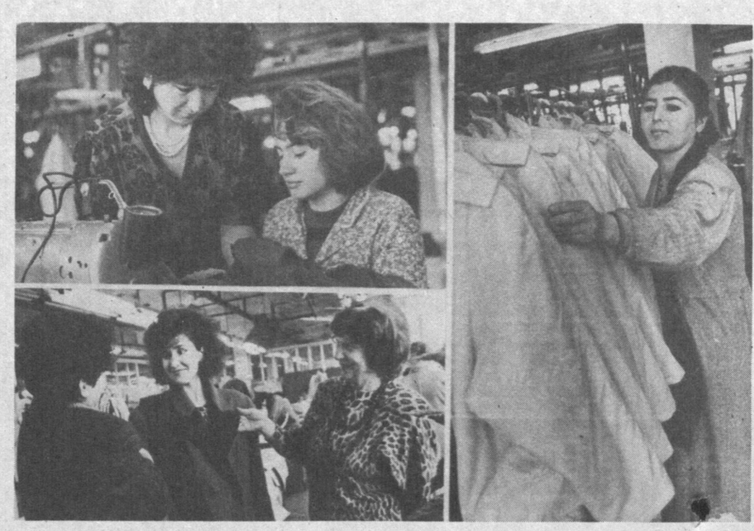
Хорошо начали 1994 год работники ташкентского производственного швейного объединения «Красная заря». По итогам первого квартала план выполнен на 115,6 процента, выпущено продукции на 8 миллиардов 570 миллионов сум-купонов. Постоянно пополняется ассортимент новых моделей. В экспериментальном цехе в месяц разрабаты-