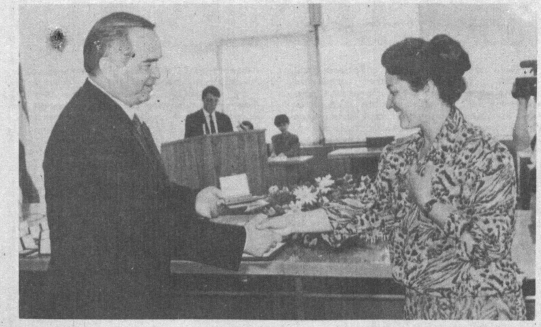
НА СНИМКЕ: во время вручения.