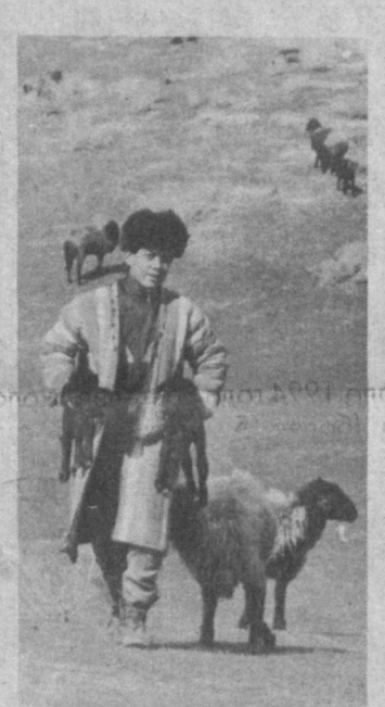
Сурхандарбинская область. Завершается охотничья компания в караулеводческом совхозе «Кукунтаг» Шерабадского района. От 38 тысяч голов овец охотники получили равное количество ягнят, из них 13 тысяч животных решили оставить для пополнения совхозного стада.

работы в этом направлении выступил председатель правления «Узавтогаса» Лутфулла Исаев. После окончания теоретической части семинара-совещания его участники ознакомились с опытом работы внедрения государственного языка в ташкентской автокомпании 2502, информационным и рекламным оформлением автовокзала «Ташкент».