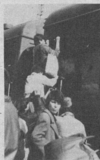
НА СНИМКЕ: посадка на поезд на станции Бухара-1.

урок не идет впрок. Не в силах кто-либо сделать и сопровождающие поезд милиционеры. — Ежедневно через Каган в сторону Туркменистана проходит три поезда, но этого явно недостаточно, — считает Т. Хайтов. — Почти каждое сопровождение этих поездов для наших сотрудников является настоящим испытанием на мужество. В лучшем случае — разорванные рубашки, потерянные фуражки и даже оторванные погоны — такой ценой распыляются милиционеры за попытку навести в поезде порядок. Т. ХИКМАТОВ, Соб. корр. «Правды Востока».