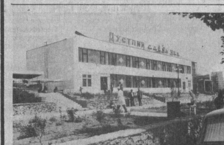
Большое внимание уделяется в Намангане благоустройству города. За короткий срок сданы в эксплуатацию жилые дома, построены новые торговые точки, рынки.