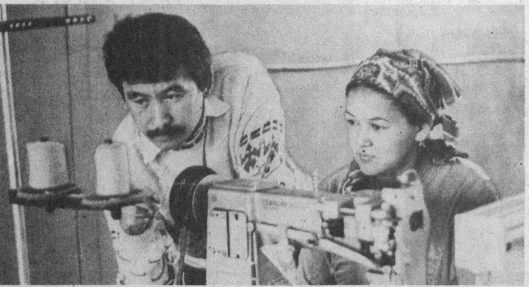
Удобную, практичную мебель, созданную по лучшим образцам, начали выпускать на Нукусском ацционерию мебельном предприятии. Специалисты германской фирмы «Майер» наладили здесь технологическую линию по выпуску матрасов для различных видов диванов и спальных гарнитуров. Мощность оборудования — 320 единиц продукции в сутки.