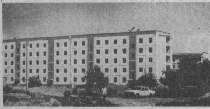
Скоро и в этом доме справят жильцы новоселье. А пока идут отделочные работы.