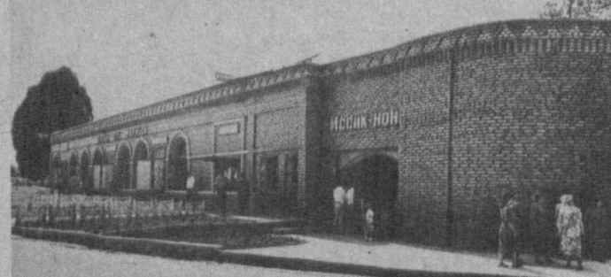
Преображаются в районе автобусные остановки. Частные владельцы, вкладывая свои средства, превращают их в красивые торговые места. Так выглядит остановка в поселке Хасанбай.

Уже по своему расположению Ташкентский район является специфичным — пригородным. В связи с этим вопрос: есть ли какие-то свои особенности здесь при переходе к рыночной экономике?