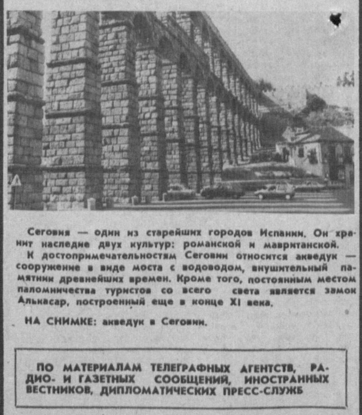
Сеговия — один из старейших городов Испании. Он хранит наследие двух культур: романской и мавританской. К достопримечательностям Сеговии относится аэведук — сооружение в виде моста с водоводом, внушительный памятник древнейших времен. Кроме того, постоянным местом паломничества туристов со всего света является замок Аликсар, построенный еще в конце XI века. НА СНИМКЕ: аэведук в Сеговии. ПО МАТЕРИАЛАМ ТЕЛЕГРАФНЫХ АГЕНСТВ, РАДИО- И ГАЗЕТНЫХ СООБЩЕНИЙ, ИНОСТРАННЫХ ВЕСТИНИКОВ, ДИПЛОМАТИЧЕСКИХ ПРЕСС-СЛУЖБ.