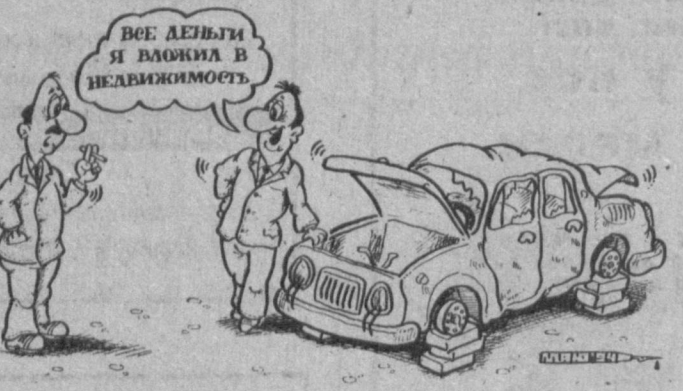
Рис. А. МАРКЕЛОВА.