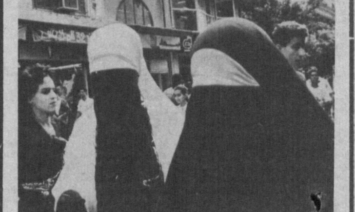
Во многих мусульманских городах мира встретить женщину в подобном наряде — не редкость.

Недавно в одной из германских клиник этот процесс был совершенно случайно запечатлен на фото-