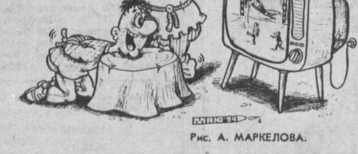
Рис. А. МАРКЕЛОВА.