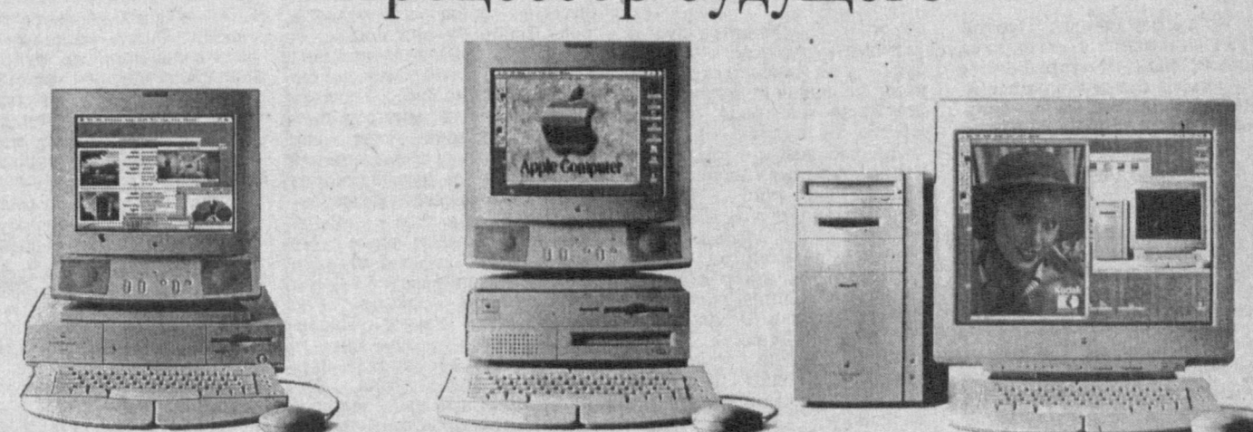
Power Macintosh 6100/60 Power Macintosh 7100/66 Power Macintosh 8100/80