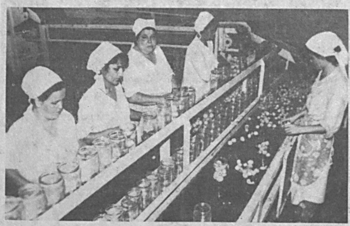
САМАРКАНДСКАЯ ОБЛАСТЬ. Обеспечить жителей Самарканды и области качественными и недорогими продуктами питания — такую задачу поставили перед собой работники торгового производственно-закупочного общества «Боходир». И это им пока удается. Многопрофильное предприятие закупает у жителей близлежащих кишлаков плодово-овощную продукцию и выпускает из нее различные виды вкусных варенья, компотов, маринады, приправы, соки, томаты — всего более 25 миллионов условных банок консервов в год. Выпекают на предприятии и «сладкую» продукцию: пряники и печенье, торты, пироги и булочки. Смонтированы линии по выпуску натурального меда и изготовлению сухофруктов.