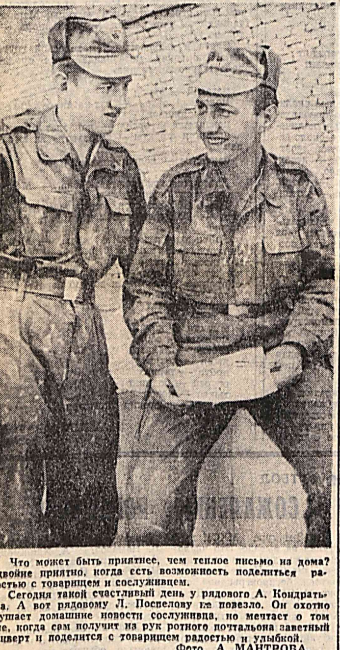
Что может быть приятнее, чем теплое письмо на дома? Вдобие принято, когда есть возможность поделиться радостью с товарищем и сослуживцем.

Унинг ҳаёти ва фаолияти чиндан ҳам жула аjoyибдир. Шонир, мушашунос, файласуф, табиб, ботаник, қимёгар, мунажжим, математик, геолог, табиатшунос ва ана қатор илмлар соҳибини Ибн Синонинг қомусий истеъдодида бутун дунё таъбирлади. Европа эливерисида дунёда унинг асарларидан 500 йил давомида асосий дарслик-қўланма сифатида фойдаланилмоқда.