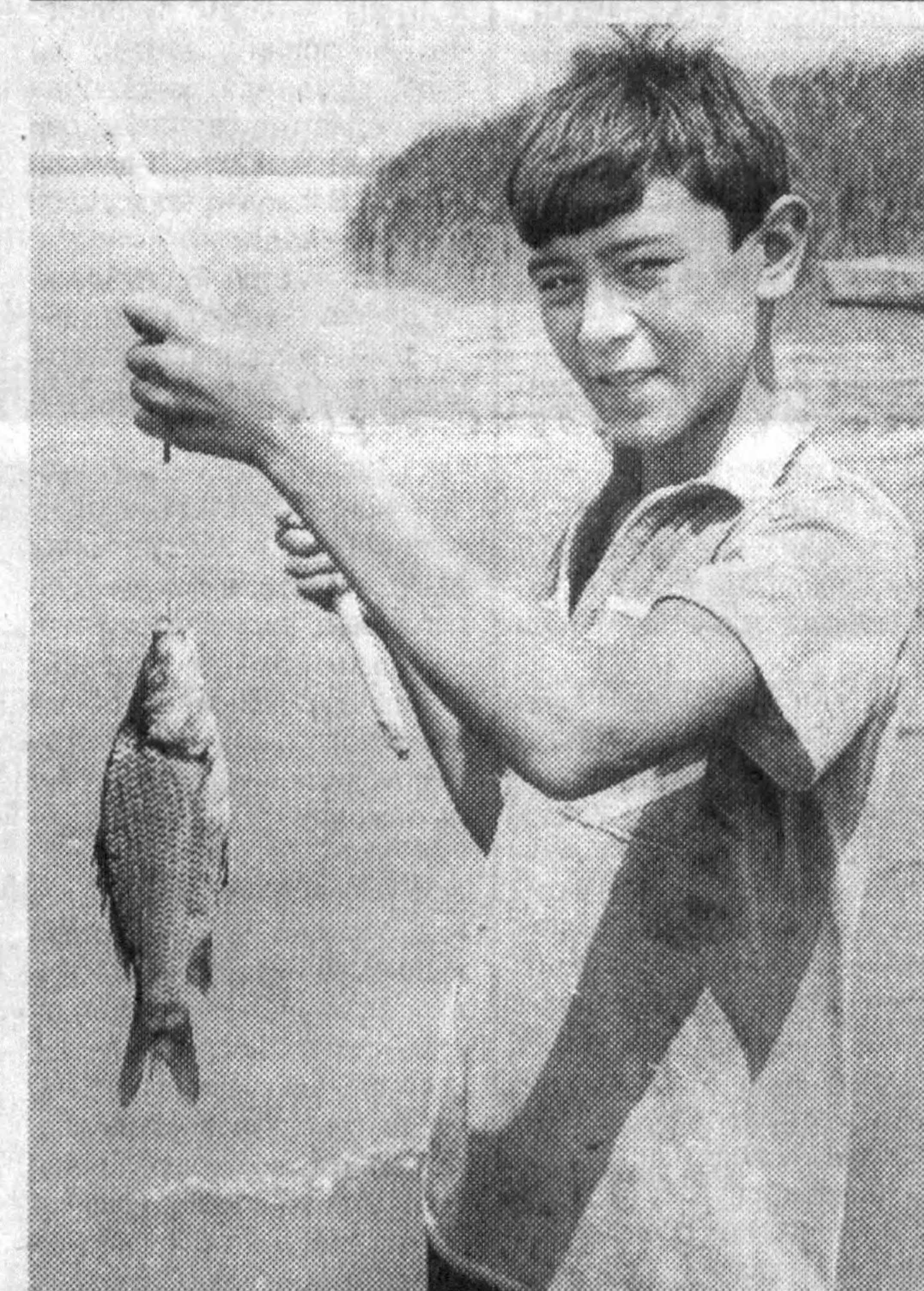
Энди балик шўрва қилсак ҳам бўлаверади.

портнинг иш сифати яхшиланди. Уюшма 2 бугунги бошқариш тизимида утгандан кейин бошқарув девони 67 кишига эки 39,6 фоизга қисқарди. Ҳозирги кунда ҳам уюшма таркибини такомиллаштириш ишлари давом этаётти. Жорий йилнинг 7 ойида 70,5 миллион йўловчи ташилди. Бу утган йилдаги нисбатан 5,9 фоиз кўп. Бунга ҳаракат воситаларининг 344 тага эки 7,2 фоиз камайганига қарамай эришилди. Олинган даромад эса 20 фоизга ошди. «Тошшаҳарйўловчитранс» давлат уюшмасида ислохотларни амалга ошириш жараёнида иқтисодий муносабатларда ҳам жиддий ўзгаришлар руй берди. Масалан, корхоналарни давлат тасарруфидан чиқариш ва хусусийлаштириш буйича қабул қилинган дастурларни амалга ошириш ҳисобига 49