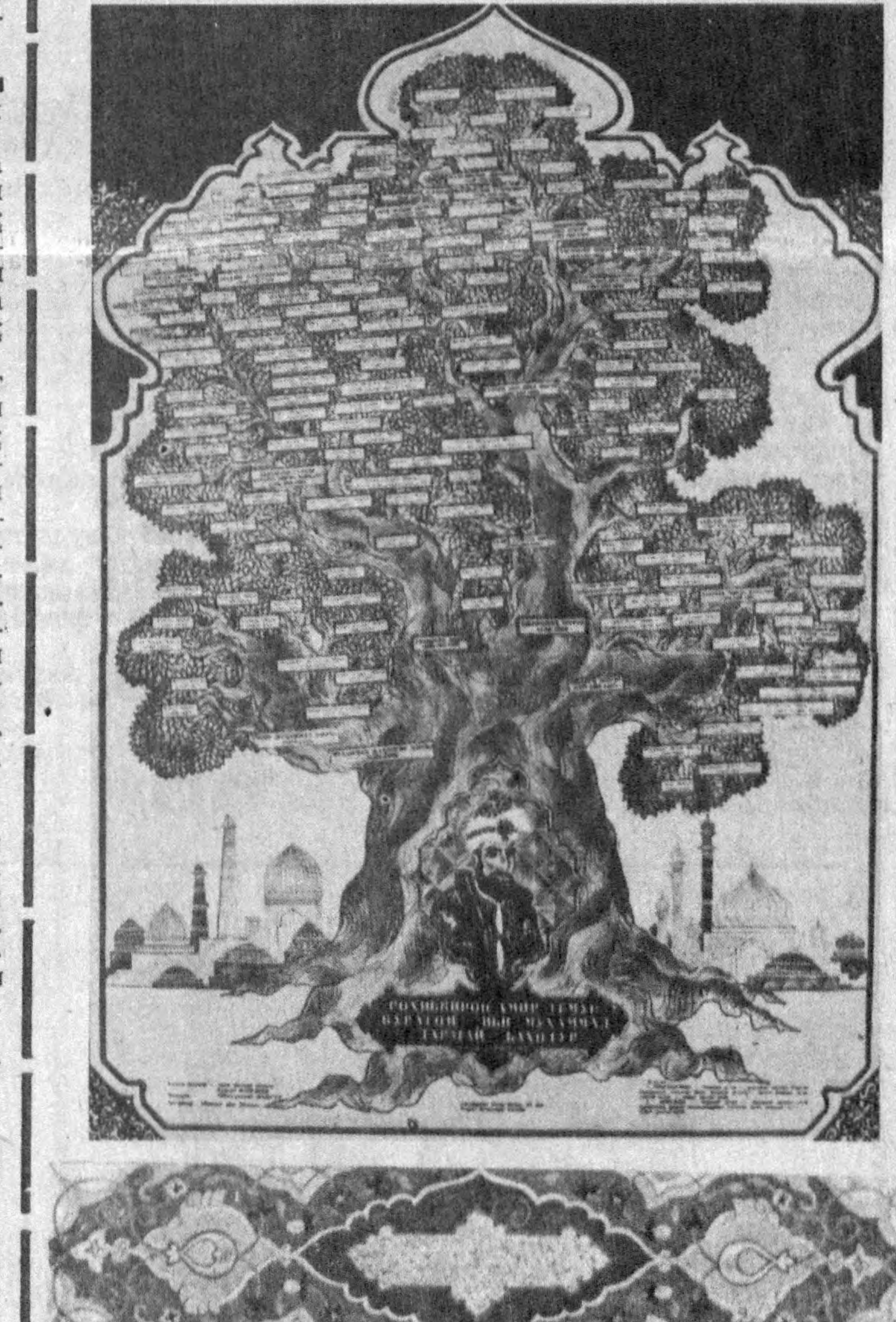
Суратқаш В. МОЛГАЧЕВ