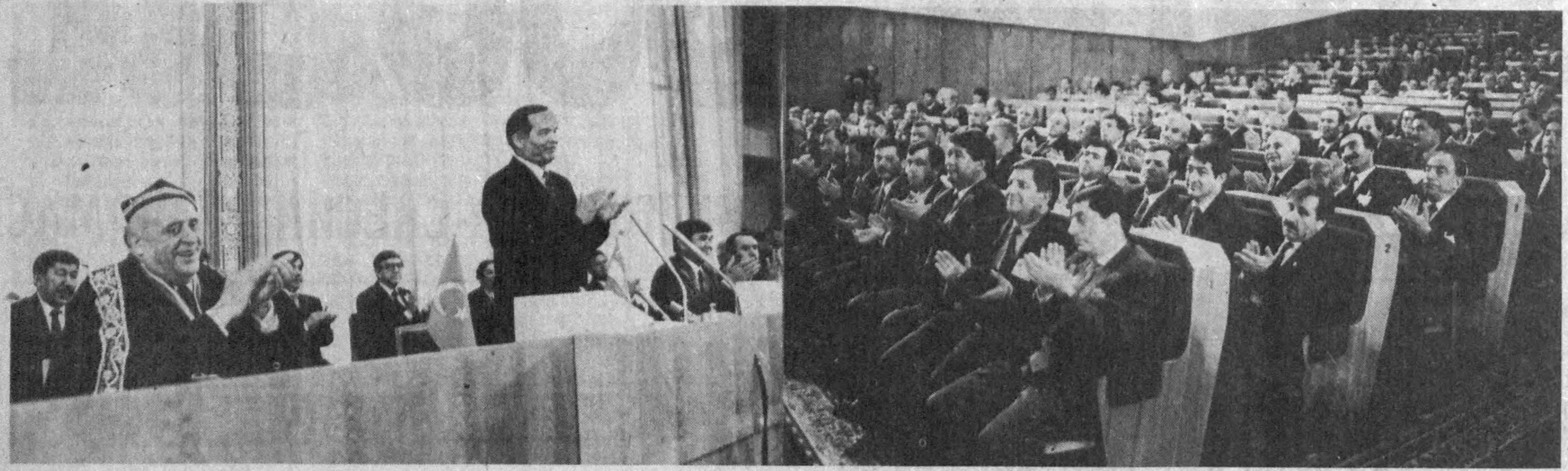
Суратларда: Ўзбекистон парламентда учрашу пайти.