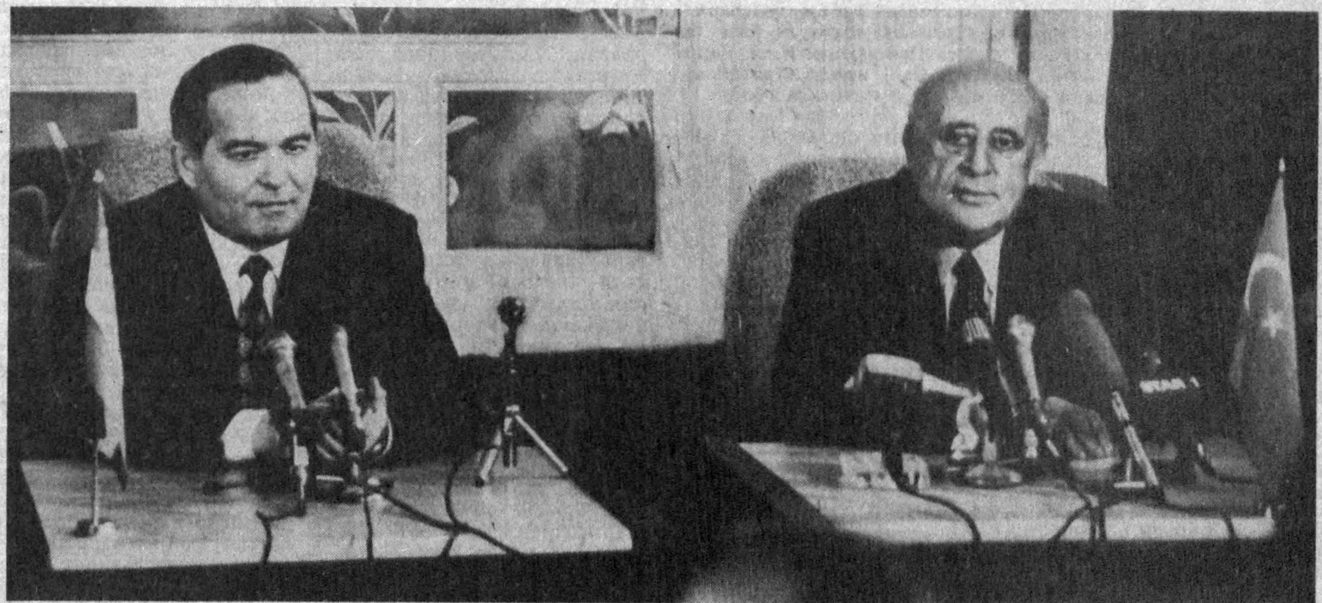
Суратда: матбуот конференциясида.