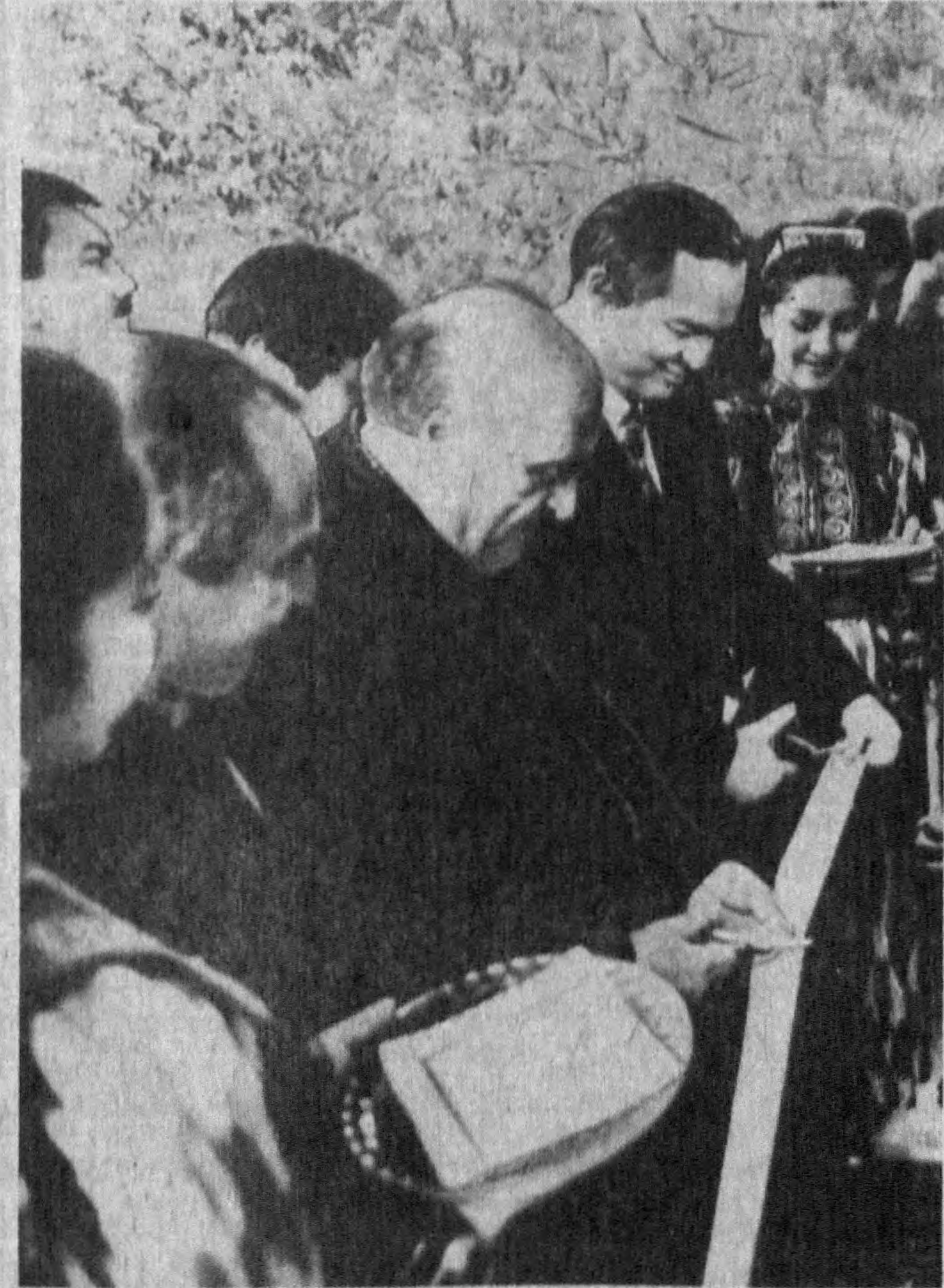
● 28 апрель кuni Тошкентда Туркия Республикасининг элчихонаси тантанали вазиетда очилди.