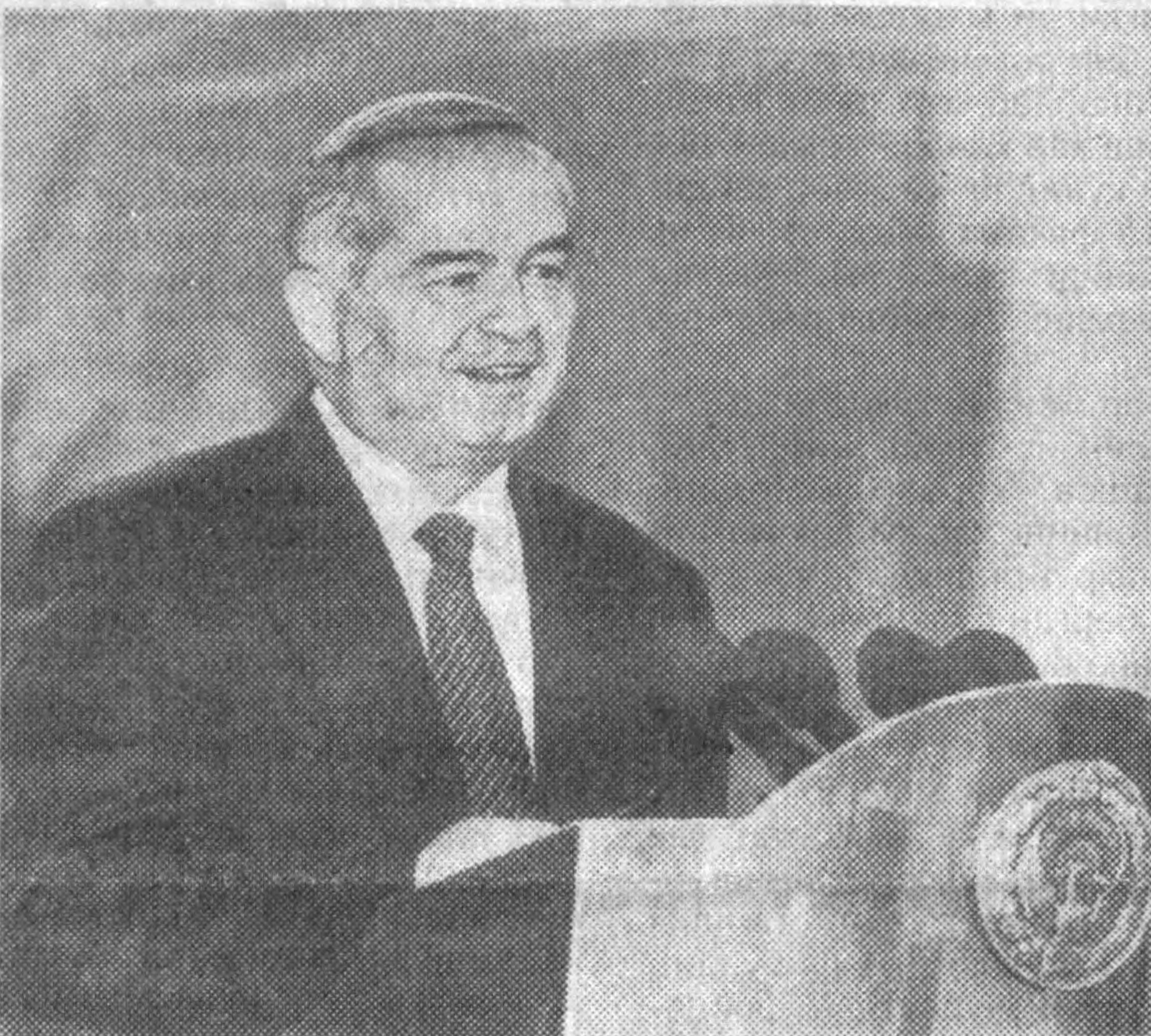
СУРАТЛАРДА: байрам тантаналаридан лавҳалар.